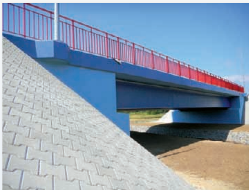
Most w miejscowości Świerczów

realizowany z województwem świętokrzyskim. To budowa mostu na Wiśle w okolicach Połańca i połączenie z drogą wojewódzką nr 764 po stronie świętokrzyskiej oraz z drogą 875 na terenie Podkarpacia. Nowy most na Wiśle w Połańcu oraz przebudowy dróg wojewódzkich łączą Rzeszów z Kielcami. Początki tej inwestycji sięgają roku 2002 – wtedy zostały podjęte pierwsze działania. Po wielu latach udało się doprowadzić do realizacji tego zadania. Inwestycja ta łączy Podkarpackie z województwem świętokrzyskim, nowa przeprawa na Wiśle będzie alternatywą dla mostów na drogach krajowych Nr 9 w Nagnajowie oraz 73 w Szczucinie. Nowy most łączy również dwa obszary działalności gospodarczej, mielecką Specjalną Strefę Ekonomiczną oraz tereny wokół Połańca, które niebawem zostaną włączone do Starachowickiej Specjalnej Strefy Ekonomicznej – tłumaczy wicemarszałek Zygmunt Cholewiński.