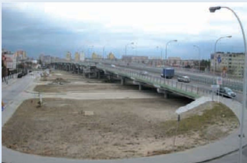
Wiadukt St. Wola