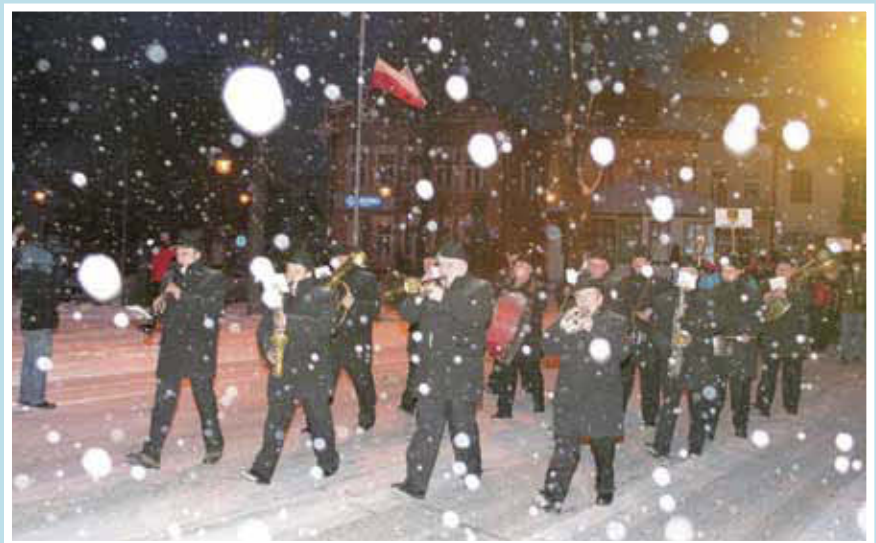
Śnieg i mróz towarzyszyły uczestnikom otwarcia olimpiady

ko latem, nie tylko piękną jesienią, nie tylko wiosną, ale również zimą. Chcie-