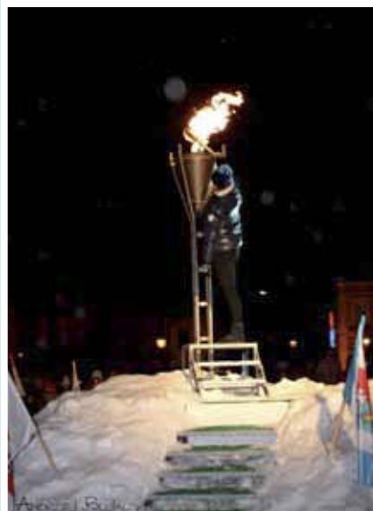
Olimpijski znicz zapłonął na rynku w Ustrzykach Dolnych

libyśmy, aby sporty zimowe rozwijały się w Sanoku, w Dębicy, w Ustrzykach i wszystkich innych miejscach, gdzie są obiekty. Gwarantuję również, że te obiekty będą powstawać w tym roku i następnych latach”.