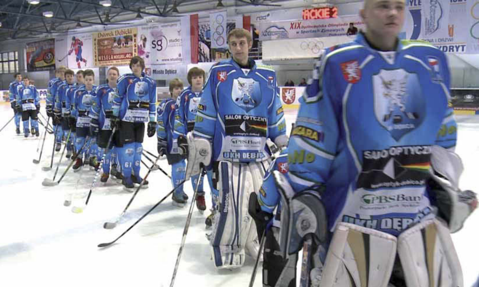
Zawodnicy Uczniowskiego Klubu Hokejowego Dębica