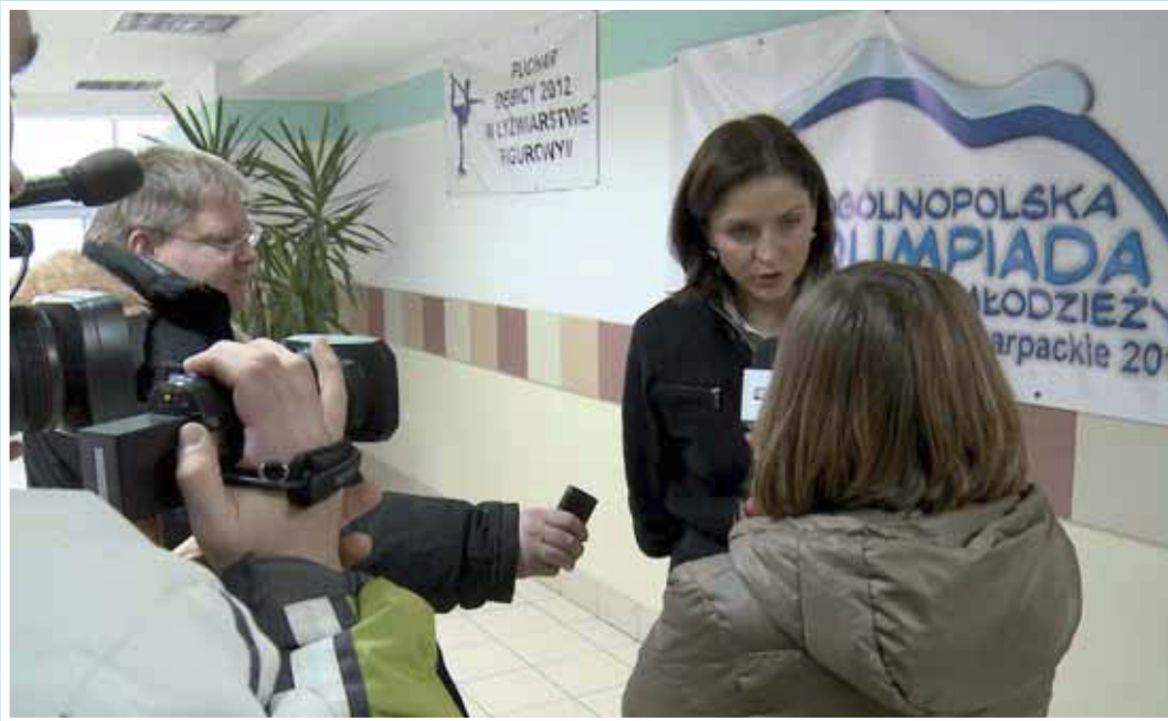
Minister Sportu i Turystyki Joanna Mucha otworzyła odbywające się w ramach olimpiady zawody w łyżwiarstwie figurowym w Dębicy