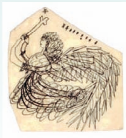
Julia Warhola, Anioł, rysunek niedatowany