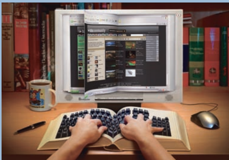
Andreas Eisler –Austria

Wybrane prace nagrodzone w konkursie „Foto Odlot”.