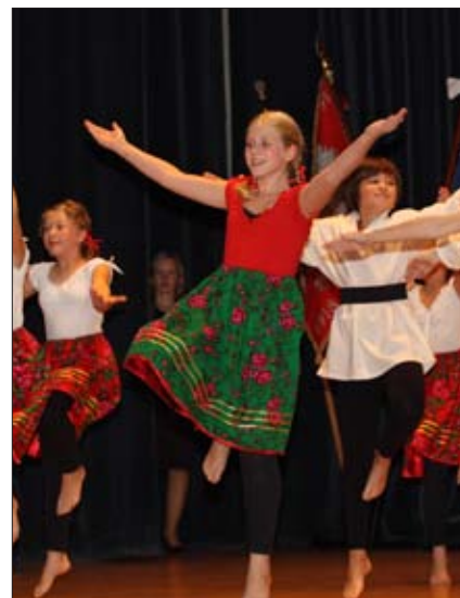
Gałę uświetniły występy artystyczne dzieci i młodzieży z regionu.