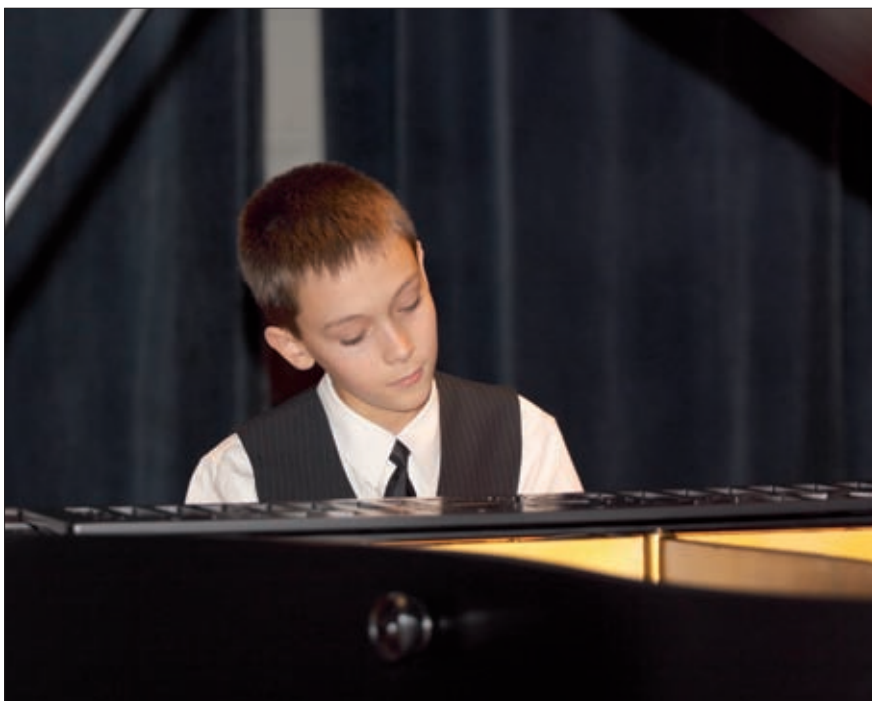
Podczas uroczystej gali na scenie zaprezentowali się uczniowie Zespołu Szkół Muzycznych im. Wojciecha Kilara w Rzeszowie.

Tegoroczna edycja konkursu zapoczątkowanego 10 lat temu przez Tygodnik Regionalny „Nowe Podkarpacie” przebiegała pod hasłem „Nasza gmina/nasze miasto/nasz powiat na finiszu kadencji 2006-2010”. Oceniając nadesłane przez samorządy ankiety, komisja konkursowa brała pod uwagę m.in. inwestycje zrealizowane w latach 2009 - 2010, pozyskane wsparcie inwestycji, projekty zgłoszone do RPO, udział w programach rządowych czy działania podejmowane na rzecz ochrony środowiska i edukacji ekologicznej. Kapituła, w skład której