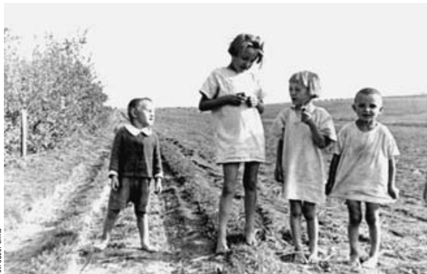
Fot. Józef Ulma

Jednak na Rzeszowszczyźnie tylko nieliczni Polacy zginęli na podstawie takich urzędowych wyroków. Niemieckie siły poli-