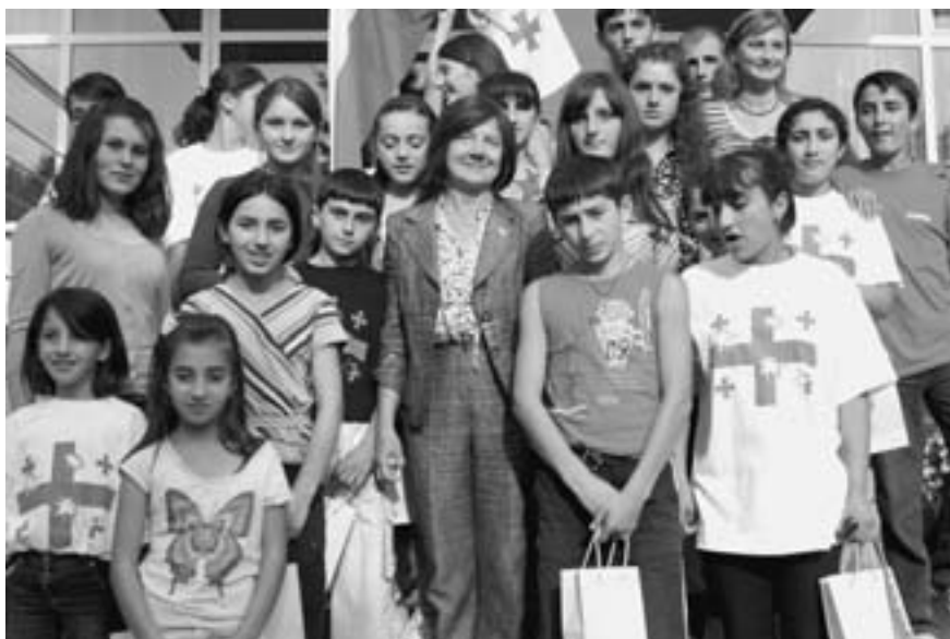
Maria Kaczyńska w otoczeniu gruzińskich dzieci w Ustrzykach Dolnych