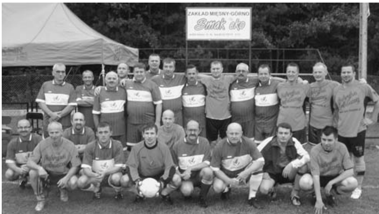
Wspólne zdjęcie uczestników pokazowego pojedynku.