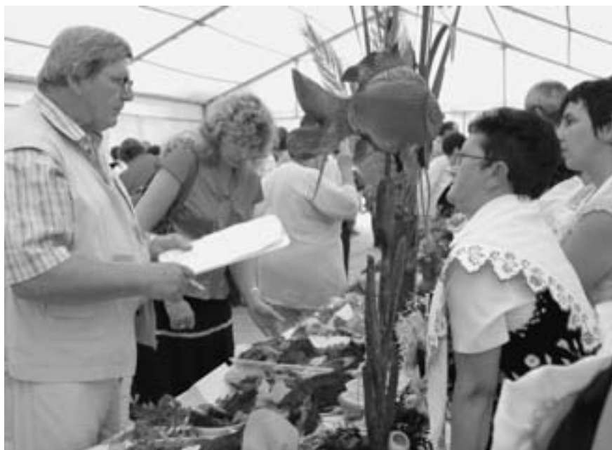
Tegorocznym „Agrobieszczadom” towarzyszyło ogromne zainteresowanie zwiedzających.