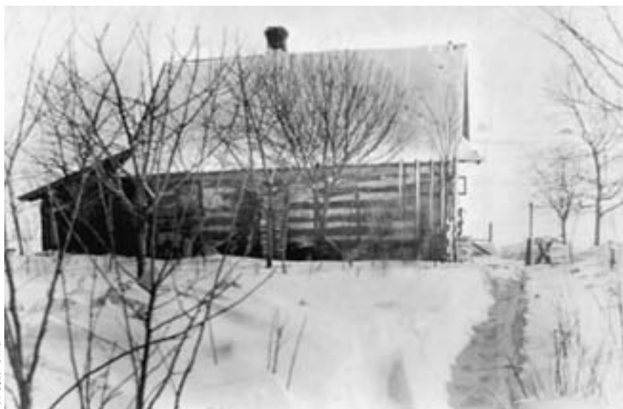
Fot. Józef Ulma

Ukrywający Żydów Polacy, prócz wyjąt- kowej odwagi i samozaparcia, musieli tak- że wykazywać się niezwykłą inwencją, aby przygotować dla swoich podopiecznych w miarę bezpieczną kryjówkę. Plany, jak