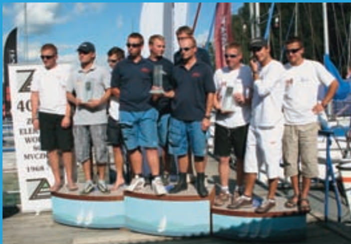
Częścią mistrzostw były regaty o puchar Marszałka. Na zdjęciu zwycięzcy tych regat (w klasie jachtów sportowych).