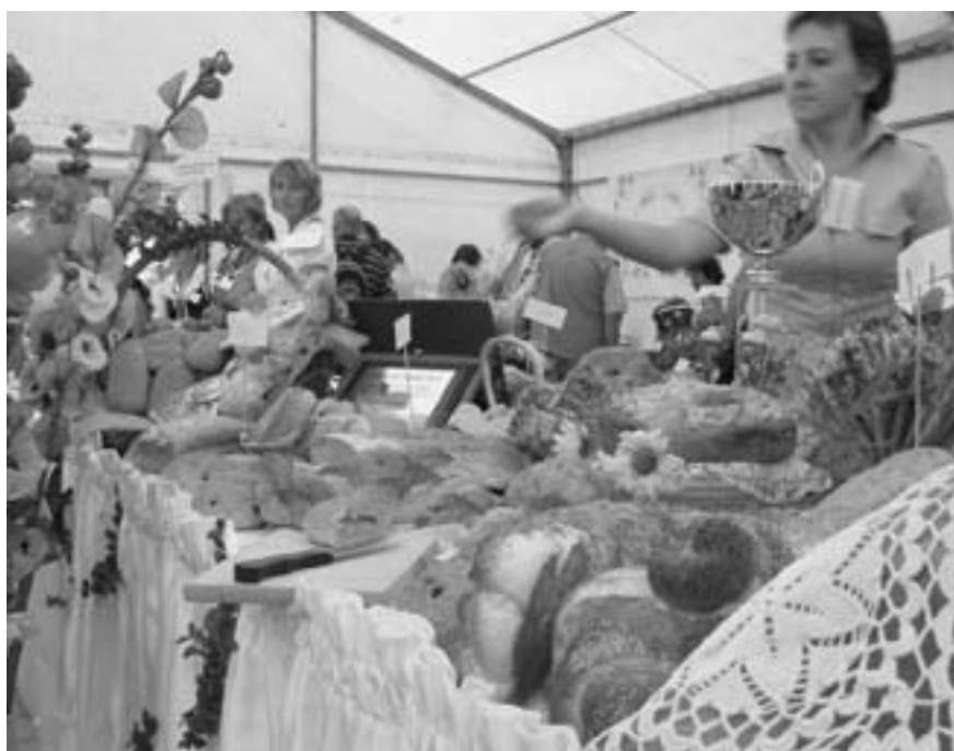
Podczas imprezy nie zabrakło stoisk z żywnością produkowaną na Podkarpaciu.