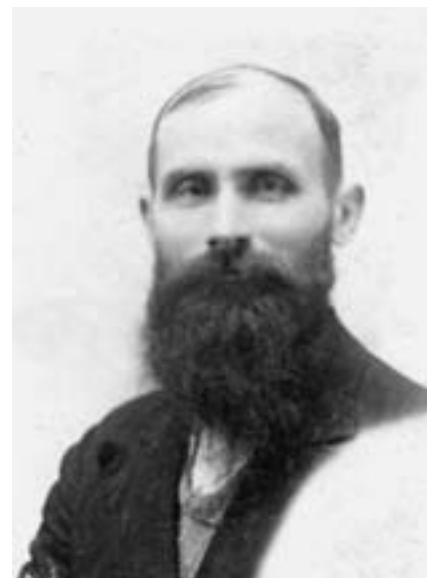
Fot. ze zbiorów Krystyny Stawarskiej-Grzędy.

Pierwszego września 1939 r. rozpoczął się konflikt niemiecko-polski. Od pierwszych dni po zajęciu przez Niemców terenów Rzeszowszczyzny Żydzi i Polacy stali się obiektem represji i grabieży. Jednak to właśnie Żydzi jako naród skazani byli przez władze niemieckie na biologiczną zagładę. Żeby przeżyć zmuszeni byli korzystać z pomocy Polaków. Aby wyeliminować takie postępowanie, w latach 1941-1942 władze okupacyjne wydały zarządzenia,