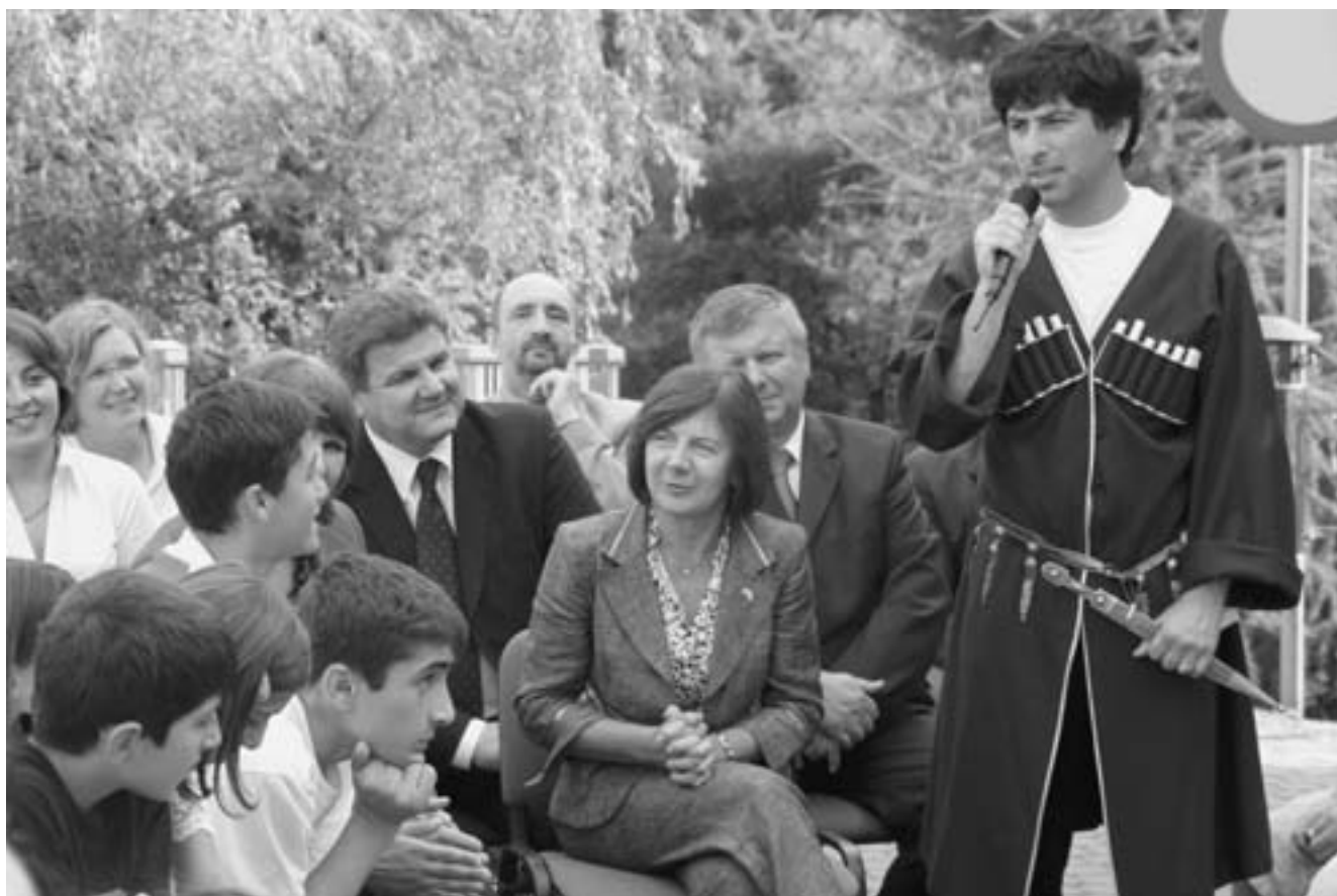
Młodzi Gruzini szybko znaleźli „wspólny język” z Marią Kaczyńską.