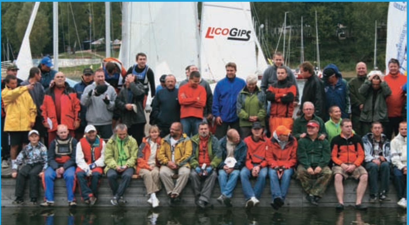
Wspólne zdjęcie przed startem.