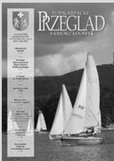
Okładka: Regaty o puchar Marszałka.