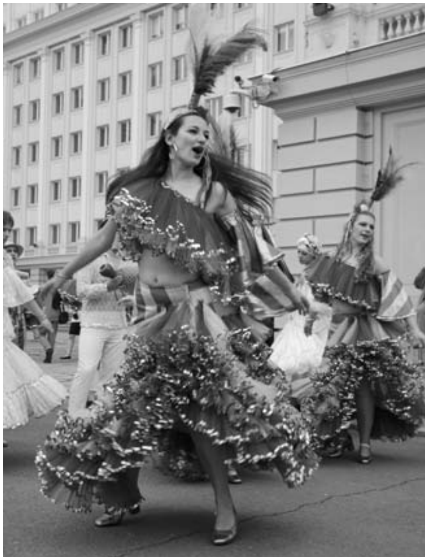
Na ulicach Rzeszowa uczestnicy festiwalu tańczyli...

Światowy Festiwal Polonijnych Zespołów Folklorystycznych po raz pierwszy zagościł w stolicy Podkarpacia w 1969 roku. Organizowany co trzy lata jest niezwykle wyjątkowym wydarzeniem, zarówno dla mieszkańców województwa podkarpackiego, jak i gości, którzy