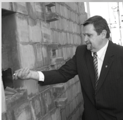
Marszałek Leszek Deptuła wmurowuje kamień węgielny pod nową siedzibę Muzeum Narodowego Ziemi Przemyskiej

go Sejmu na obchody rocznicy Zbrodni Katyńskiej. – 10 kwietnia będą miał zaszczyt i honor złożyć hołd wymordowanym polskim oficerom. Udaję się w to szczególne miejsce dla serc wszystkich Polaków – podkreślał przed wylotem na uroczystości.