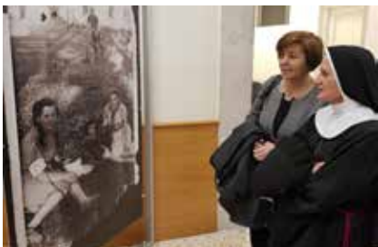
Wystawa cieszyła się dużym zainteresowaniem