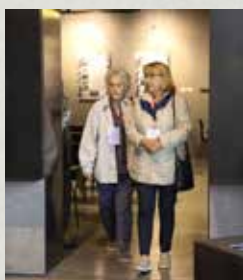
Sprawiedliwi zwiedzili Muzeum w Markowej