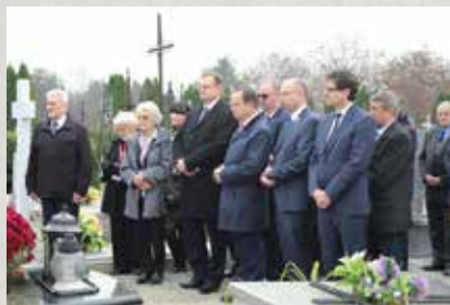
Modlitwa na grobie Rodziny Ulmów