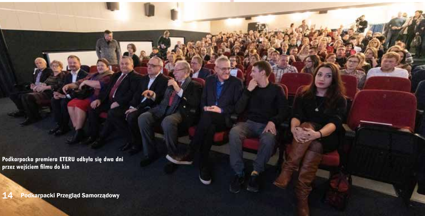
Podkarpacka premiera ETERU odbyła się dwa dni przed wejściem filmu do kin