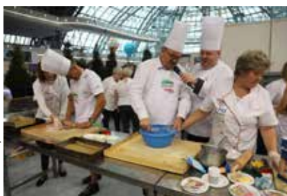
VIP-y GOTUJĄ – Wicemarszałek Piotr Pilch przygotowywał świąteczne pierniki