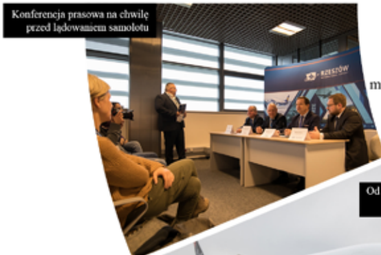
Konferencja prasowa na chwilę przed lądowaniem samolotu