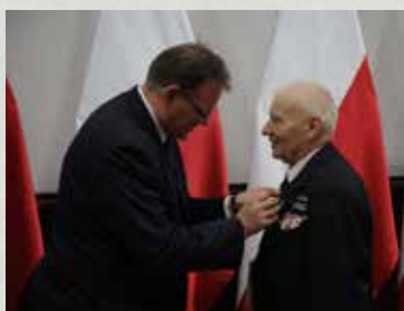
Wręczenie odznaczeń państwowych

„Sprawiedliwi” to osoby nieżydowskiego pochodzenia, które za pomoc okazaną Żydom podczas II wojny światowej otrzymały odznaczenie honorowe przyznawane przez państwo Izrael. O nadaniu tytułu Sprawiedliwego wśród Narodów Świata decyduje Instytut Yad Vashem w Jerozolimie.