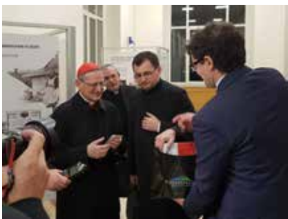
Kardynał Amato otrzymuje symboliczny dzwon niepodległości