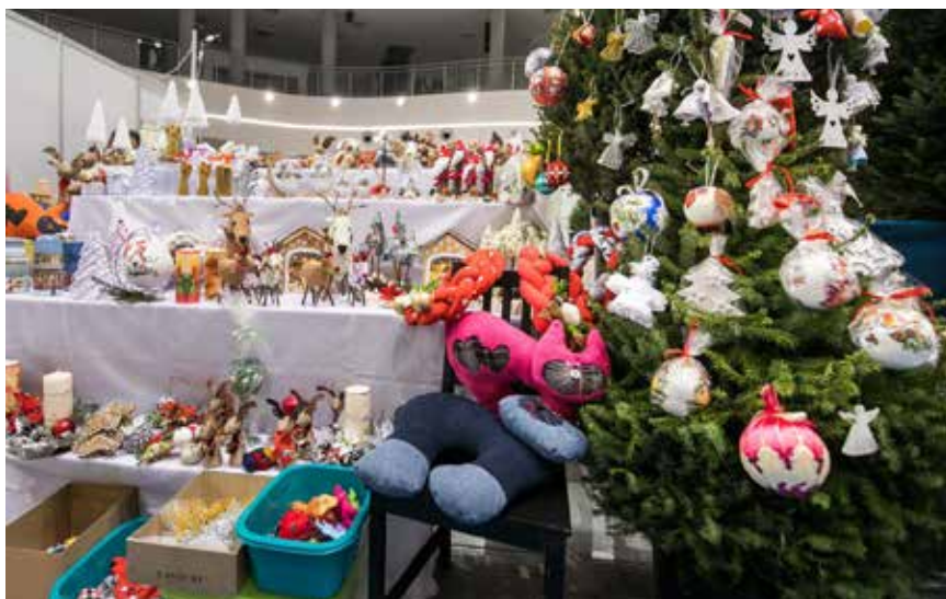
Barwnie i kolorowo było na tegorocznej Ekogali

W XII Ekogali uczestniczyło blisko 150 wystawców, producentów i wytwórców. Mięsa, wędliny, ryby, oleje, nabiał, pie-