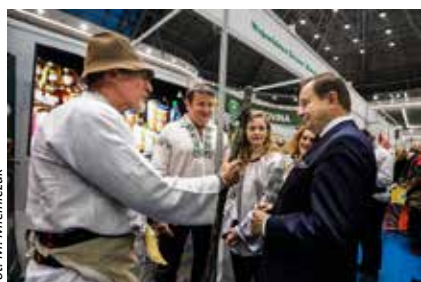
Targi to okazja do spotkań i rozmów