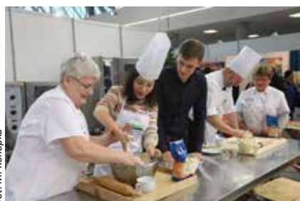
VIP-y GOTUJĄ – Chińscy goście chętnie zgłębiali tajniki tradycyjnych potraw świątecznych