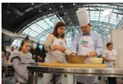
VIP-y GOTUJĄ – Marszałek Władysław Ortyl testował swe kulinarne talenty przy przygotowaniu ruskich pierogów