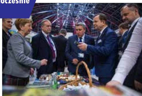
X Forum Europa - Ukraina