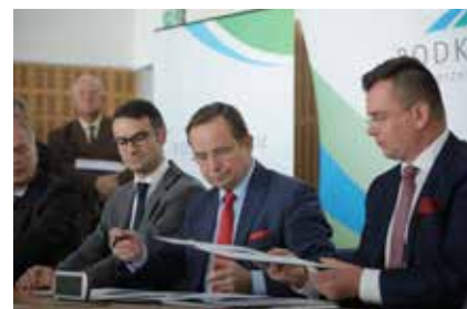
Podpisanie aneksu do KT

Po podpisaniu aneksu do KT podkarpacki odcinek nabrął bardziej realnych szans na powstanie w całości.