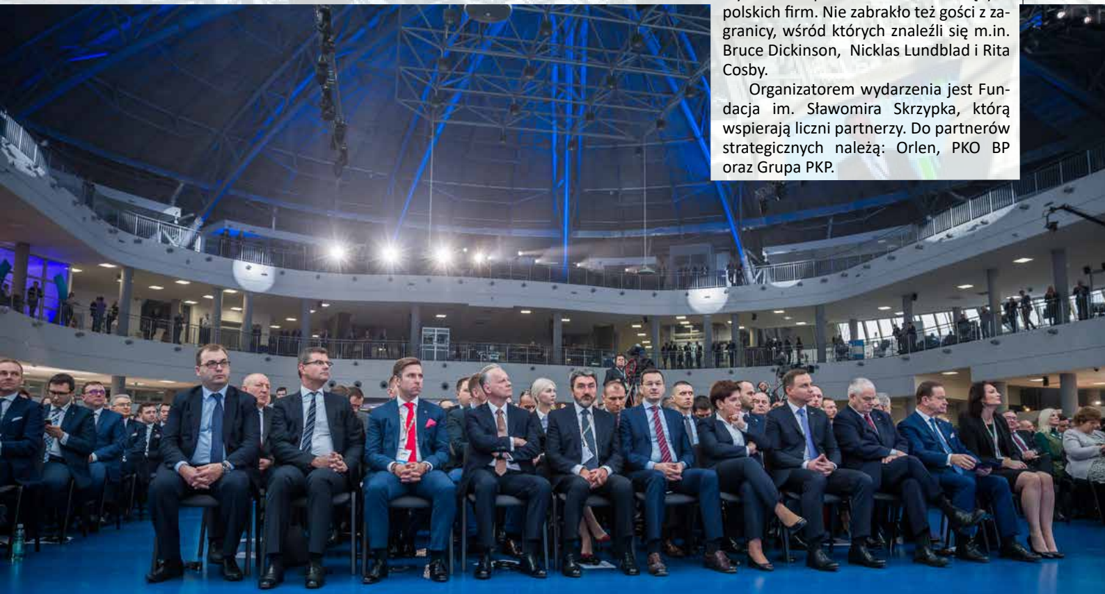
Na kongresie obecne były najważniejsze osoby w kraju

Organizatorem wydarzenia jest Fundacja im. Sławomira Skrzypka, którą wspierają liczni partnerzy. Do partnerów strategicznych należą: Orlen, PKO BP oraz Grupa PKP.