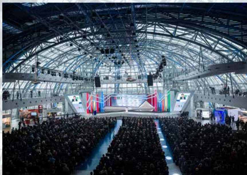
G2A ARENA w Jasionce – miejsce I Kongresu 590

Wybitni prelegenci, szeroki zakres omawianych tematów, możliwość rozmów w kulisach z politycznymi i gospodarczymi tuzami, do tego pogłębione analizy ekspertów oraz trafne diagnozy na przyszłość.