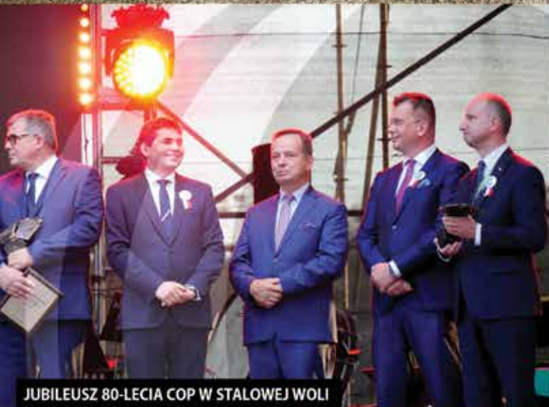
JUBILEUSZ 80-LECIA COP W STALOWEJ WOLI