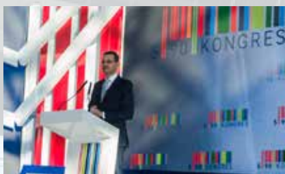
Wicepremier M. Morawiecki Konstytucję Biznesu przedstawił własnie na Podkarpaciu

Nieprzypadkowo Kongres 590 odbywa się w podzeshzowskiej Jasionce w Centrum Wystawienniczo-Kongresowym Województwa Podkarpackiego.