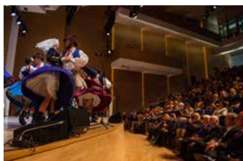
Forum Polonii Amerykańskiej