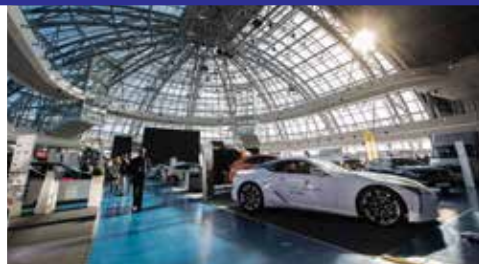
Targi Motoryzacyjne TSLA EXPO

ponad 20 wydarzeń może się odbywać jednocześnie w przestrzeni CWK G2A Arena