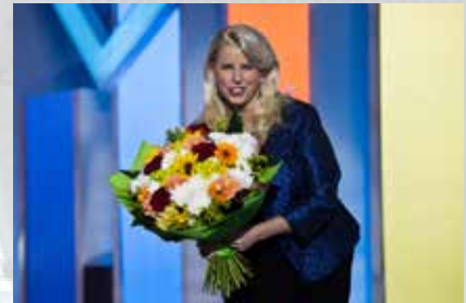
Gościem specjalnym kongresu była amerykańska dziennikarka Rita Cosby