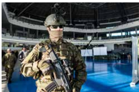
Konferencja - Innowacje w Wojsku