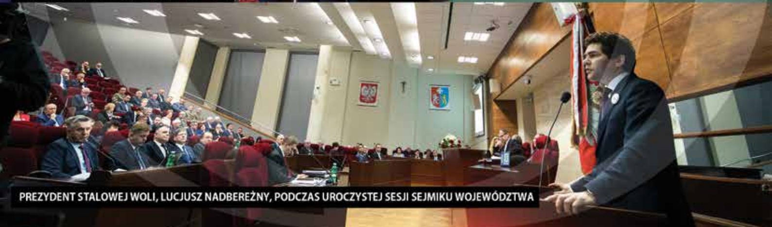
PREZYDENT STALOWEJ WOLI, LUCJUSZ NADBEREŻNY, PODCZAS UROCZYSTEJ SESJI SEJMIKU WOJEWÓDZTWA