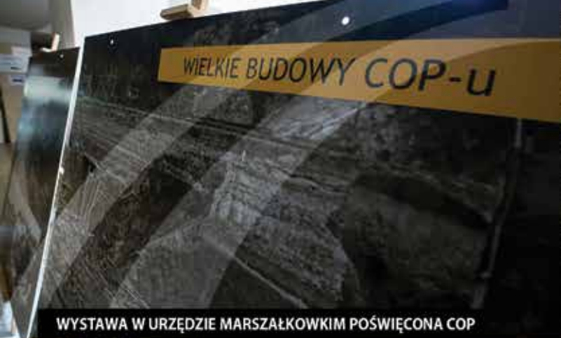
WYSTAWA W URZĘDZIE MARSZAŁKOWKIM POŚWIĘCONA COP