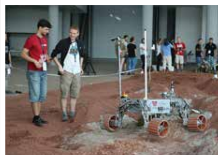
European Rover Challenge