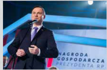
I edycję kongresu otworzył Prezydent RP Andrzej Duda

Kongres 590 zakończy się uroczystą galą, podczas której z pewnością będzie okazja do podsumowań i mniej formalnych rozmów.