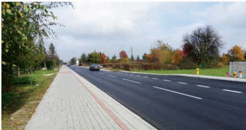
Droga Olbięcin -Stalowa Wola