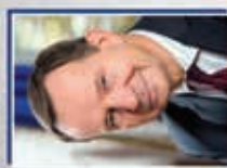
Władysław Ortyl Marszałek Województwa