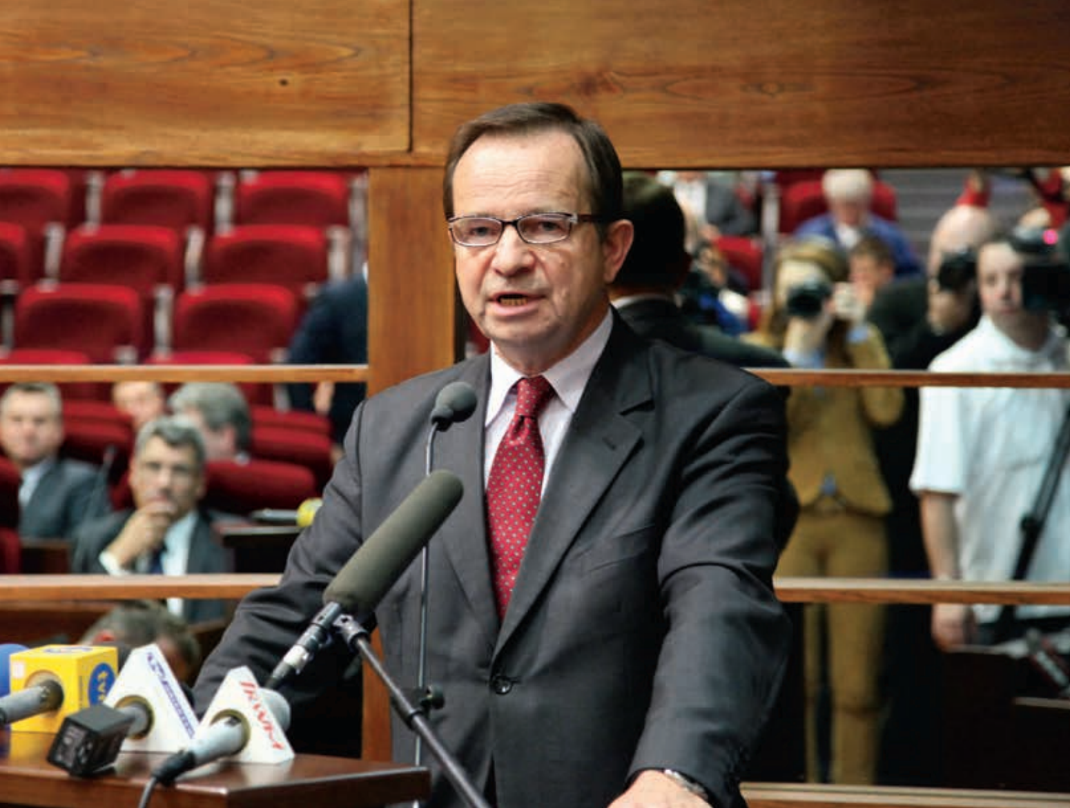
Wystąpienie Władysława Ortyła na sesji 27 maja 2013 r, kiedy został wybrany na marszałka województwa

cyjemy jej założenia w kontrakcie terytorialnym oraz nowym Regionalnym Programie Operacyjnym na lata 2014-2020. Chcemy otwarcia drogowego na południe. Jego osią czy też kręgosłupem ma być droga ekspresowa S19 od Rzeszowa do granicy państwa. Liczymy, że w najbliższym czasie znajdą się pieniądze na etap I do Babicy. Szukamy sprzymierzeńców w Parlamencie Europejskim. S19 determinować będzie kolejne drogowe projekty, które chcemy, aby znalazły się w kontrakcie terytorialnym lub w nowym RPO. Walczymy też o zjazdy z autostrady A4. Ten szlak, tak wyczekiwany przez mieszkańców Podkarpacia nie może dzielić, ale musi łączyć. Obecne zjazdy pozostawiają wiele do życzenia, brakuje zjazdu w Pilźnie. Duży ruch zjeżdża na niedostosowane drogi powiatowe. Nie możemy na to pozwolić.