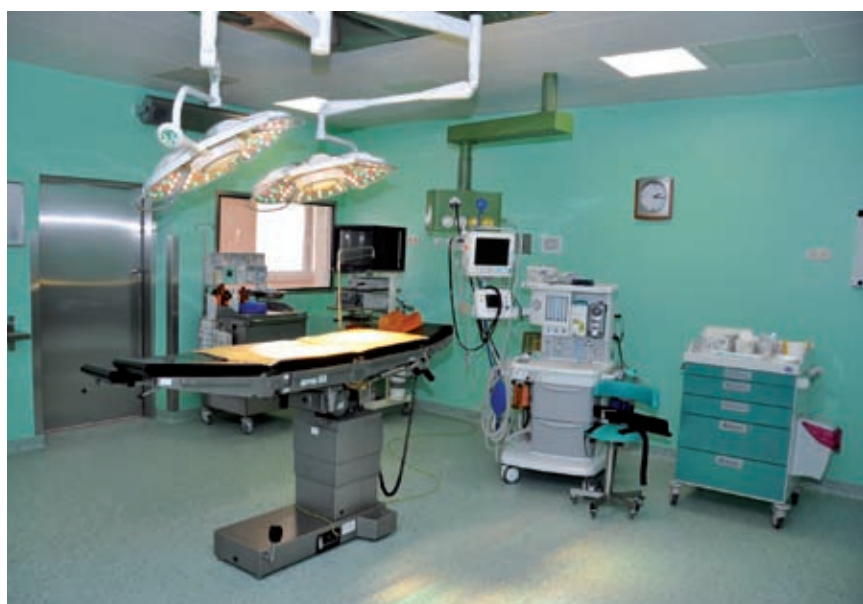
Nowoczesny blok operacyjny w szpitalu onkologicznym w Brzozowie