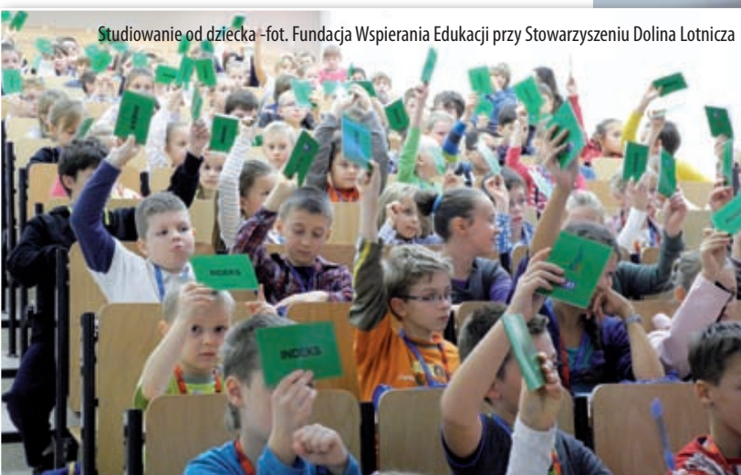
Studiowanie od dziecka