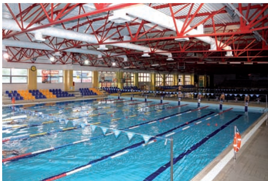
Kryta pływalnia w Dębicy