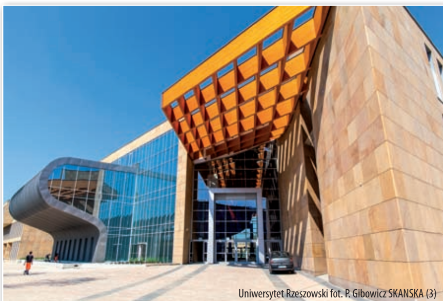
Uniwersytet Rzeszowski fot. P. Gibowicz SKANSKA (3)

Unijne pieniądze zmieniły nasz region pod wieloma względami, ale z pewnością środki wydane na edukację i rozwój przedsiębiorczości pozwoliły zbudować kapitał, który w najbliższych latach zaprocentuje w postaci nowych miejsc pracy, rozwoju gospodarczego i społecznego regionu, szczególnie, że mamy jeszcze do wykorzystania kolejne olbrzymie pieniądze w latach 2014-2020.