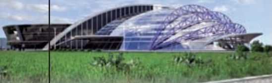
Wizualizacja Centrum Wystawieniczo-kongresowego w Jasionce

Już wiadomo, że w latach 2014 - 2020 na rozwój pięciu województw Polski Wschodniej pójdzie kolejnych ponad 2,11 mld euro.