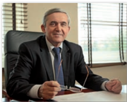
Jan Burek – Wicemarszałek Województwa Podkarpackiego

Członkostwo Polski w Unii Europejskiej wiąże się z ogromnymi korzyściami nie tylko dla polskiej gospodarki, ale również z korzyściami społeczno-kulturalnymi. Należy zwrócić szczególną uwagę na możliwości rozwojowe polskiej nauki, w której członkostwo w Unii przyczyniło się niewątpliwie do poprawy jakości kształcenia, dzięki czemu polskie ośrodki naukowo-badawcze w tym szkoły wyższe z naszego województwa uzyskały możliwość finansowania działalności z unijnych funduszy przeznaczanych na badania i rozwój, a także nieograniczony dostęp do najnowszej infrastruktury badawczej i nowoczesnych technologii badawczych. W ramach Regionalnego Programu Operacyjnego Województwa Podkarpackiego na lata 2007-2013 dofinansowano 32 projekty szkół wyższych na łączną kwotę 457,5 mln zł. Inwestycje w infrastrukturze uczelni