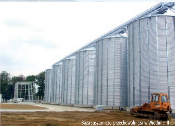
Baza suszarniczoprzechowalnicza w Wietlinie III