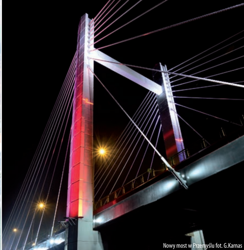
Nowy most w Przemyślu

Podkarpacie otwiera się także na świat. Unijne pieniądze pozwoliły zbudować w porcie lotniczym Rzeszów-Jasionka nowy terminal pasażerski, powstały płyty postojowe i drogi kołowania, a także szereg mniejszych, ale równie ważnych inwestycji. Mają one przełożenie na stale rosnący ruch pasażerów.