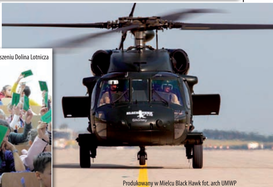
Produkowany w Mielcu Black Hawk