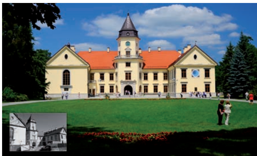
Zamek w Tarnobrzegu