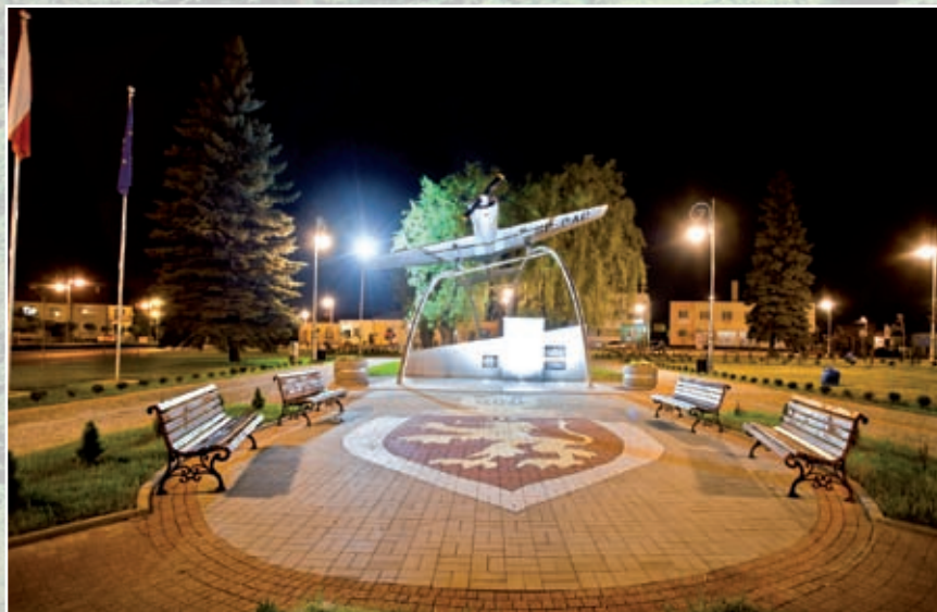
Przebudowany rynek w Radomyślu Wielkim

Prawie 3 tysiące operacji, bo tak nazywają się projekty realizowane w programie, o łącznej wartości prawie 900 mln złotych i dofinansowaniu rzędu pół miliarda złotych realnie zmienia obraz obszarów wiejskich Podkarpacia. Oczywiście nie wszystko, co potrzebne lokalnym społecznościom udało się zrobić. Najważniejsze jest jednak to, że w rozwój swych wspólnot włączyli się wszyscy: samorządowcy, przedsiębiorcy, organizacje pozarządowe, rolnicy. To ich zaangażowanie i przygotowane projekty sprawiły, że zmiany są widoczne gołym okiem – mówi