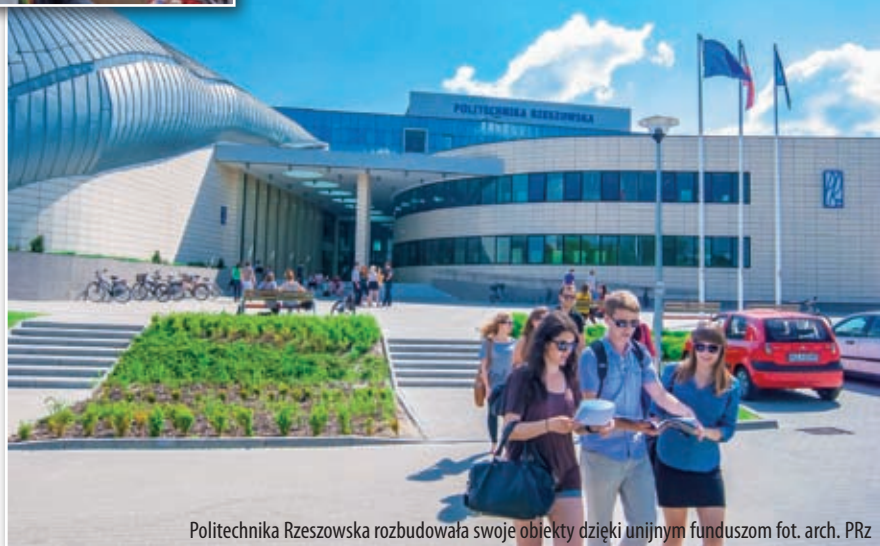
Politechnika Rzeszowska rozbudowała swoje obiekty dzięki unijnym funduszom