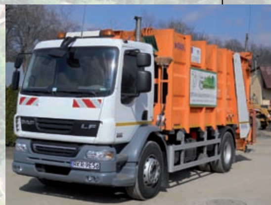
Segregacja odpadów w Dukli

Nowe wyzwania i możliwości oraz kolejne miliardy euro z budżetu Unii Europejskiej dla Polski na lata 2014-2020 dadzą rolnikom kolejną szansę na zmianę oblicza podkarpackiego rolnictwa.