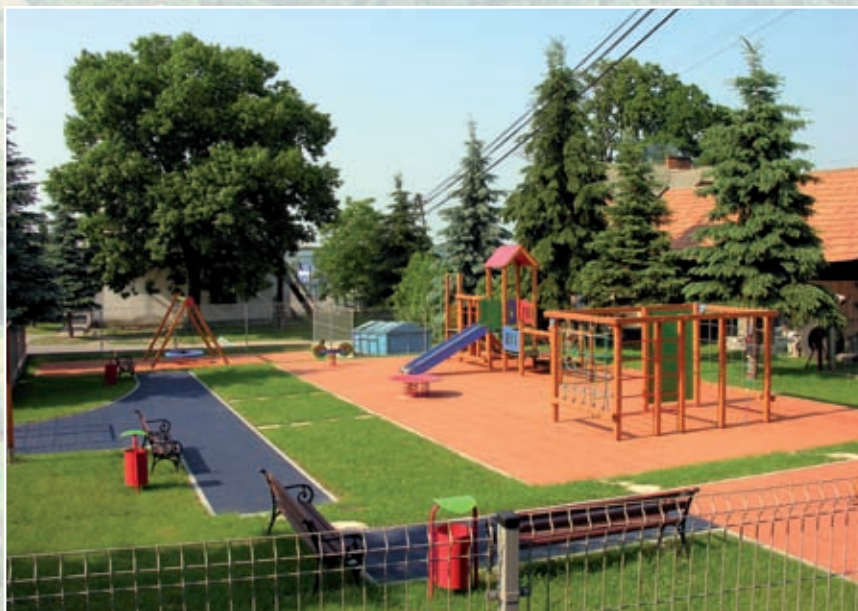
Plac zabaw w Lubzinie

Od 2004 do 2006 roku samorząd Podkarpacia wdrażał Sektorowy Program Operacyjny Restrukturyzacja i Modernizacja Sektora Żywnościowego.