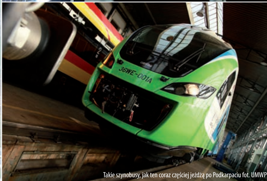
Takie szynobusy, jak ten coraz częściej jeżdżą po Podkarpaciu