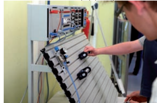
Regionalne Centrum Transferu Nowoczesnych Technologii Wytwarzania w Mielcu

miejsc pracy w zakończonych już projektach. Unikatowym przedsięwzięciem w skali kraju jest natomiast dwanaście projektów Regionalnych Centrów Transferu Nowoczesnych Technologii Wytwarzania, będących nowoczesną bazą dydaktyczną służącą kształceniu kadr dla podkarpackiej gospodarki.