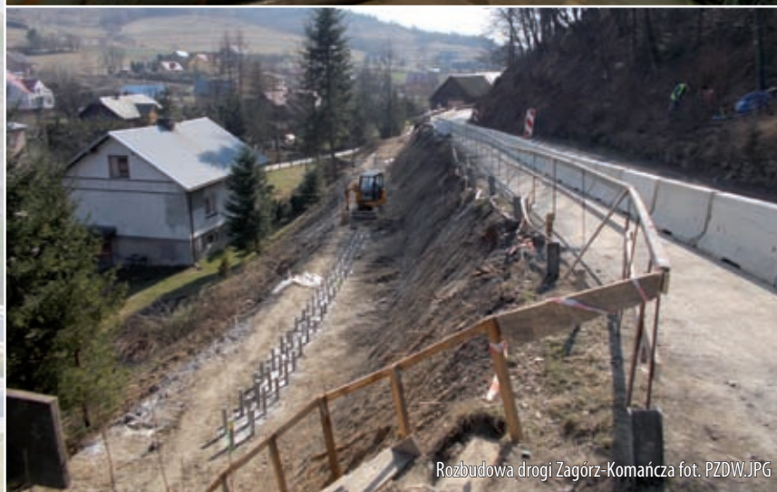
Rozbudowa drogi Zagórz-Komańcza.JPG