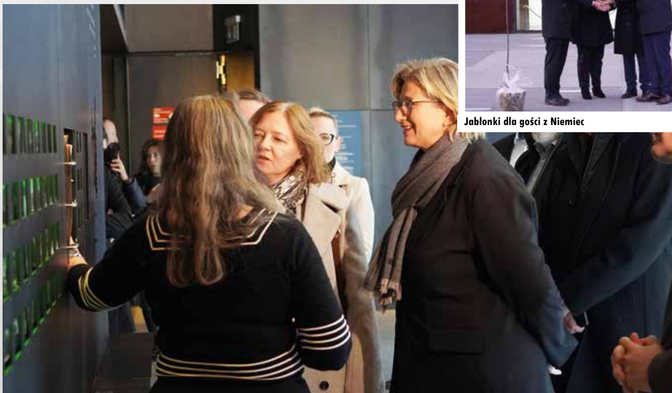
Premier Kraju Saary zwiedziła muzeum w Markowej