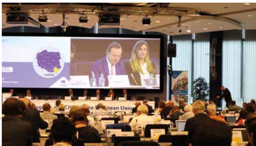
Prezentacja opinii przez marszałka.

czące oceny oddziaływania terytorialnego. Pod koniec maja odbyły konsultacje w formule tzw. wysłuchania publicznego. Finalną wersję, COTER przyjęła pod