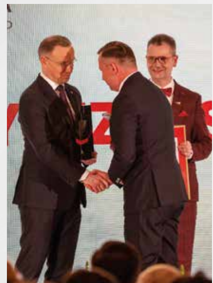
Gratulacje od prezydenta Andrzeja Dudy