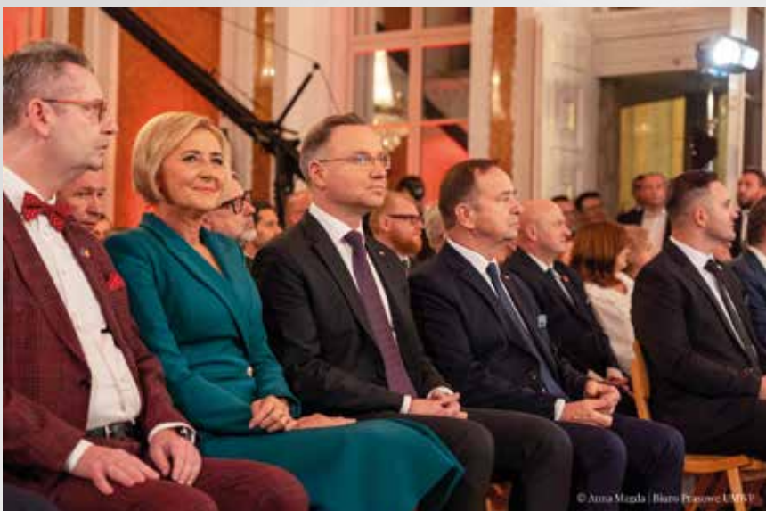
Prezydentowi RP towarzyszyła małżonka Agata Kornhauser-Duda