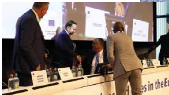
Gratulacje po głosowaniu nad opinią dronową

Europejski Komitet Regionów to głos miast i regionów w Unii Europejskiej. Reprezentuje samorzady z całej Unii Europejskiej i doradza w sprawie nowych przepisów, które mają wpływ na miasta i regiony. Członkowie, to samorządowcy pochodzący ze wszystkich krajów UE.