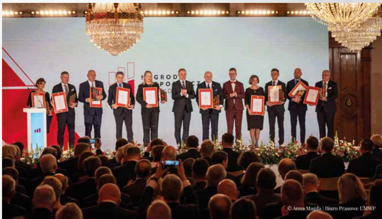
Zwycięzcy konkursu i laureaci nagród specjalnych