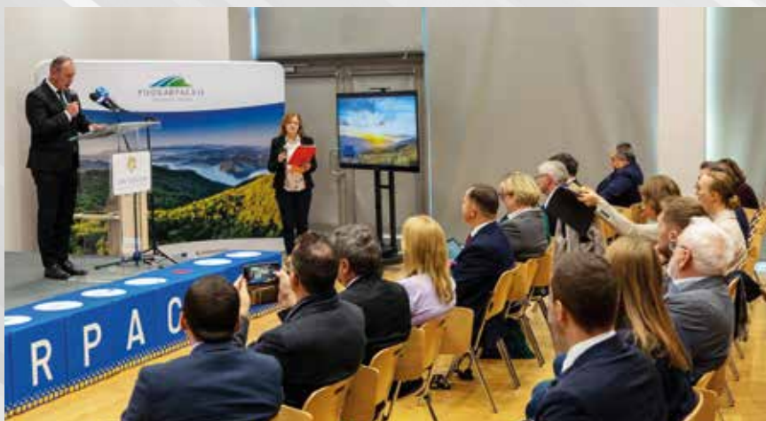
Spotkanie w PPNT w Jasionce

– Jesteśmy niewielkimi regionami, dlatego chcemy się uczyć, wymieniać doświadczeniami, jak wykorzystywać szanse, a także, jak korzystać z położenia przy granicy z innymi krajami. Pandemia przeszkodziła ostatnio w organizacji wielu spotkań, ale nasze stosunki nie bazują tylko na oficjalnych wizytach, ale raczej współpraca nasza jest oparta na bogatych kontaktach na niższym szczeblu – mówiła premier Anke Rehlinger.