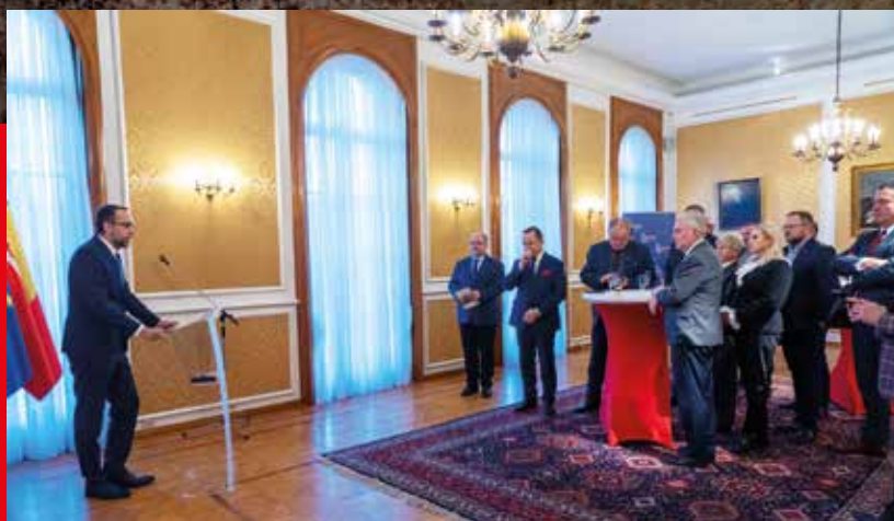
Spotkanie w Ambasadzie RP przy Królestwie Belgii

Wystawa niemal w całości w prezentowanym obecnie kształcie graficznym