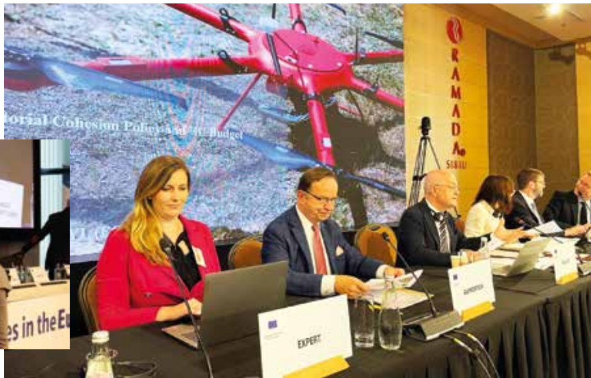
Dyskusja w trakcie komisji COTER