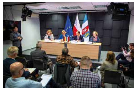
Wspólna konferencja prasowa w UMWP

Ostatnim punktem wizyty niemieckiej delegacji na Podkarpaciu było zwiedzanie Muzeum Polaków Ratujących Żydów podczas II wojny światowej im. Rodziny Ulmów w Markowej.