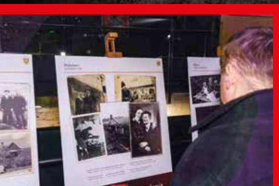
Wystawa „Samarytanie z Markowej” została wyeksponowana również przed projekcją filmu