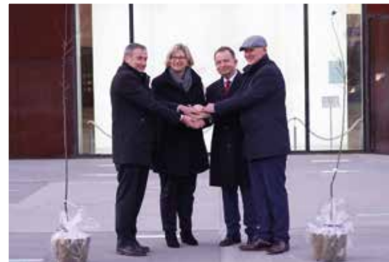
Jabłonki dla gości z Niemiec