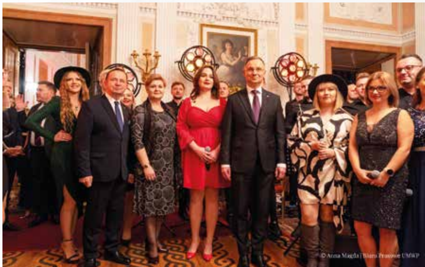
Wspólne zdjęcie z artystami z MDK w Przecławiu

Galę zakończył koncert młodych artystów z Domu Kultury w Przecławiu. W ich wykonaniu zostały zaprezentowane piosenki z tekstami Agnieszki Osieckiej.