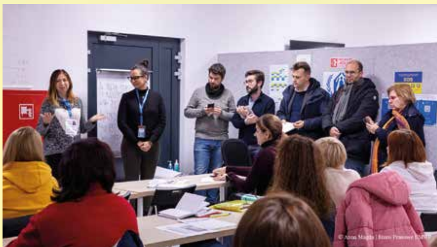
Dziennikarze watykańscy spokali się z uchodźcami