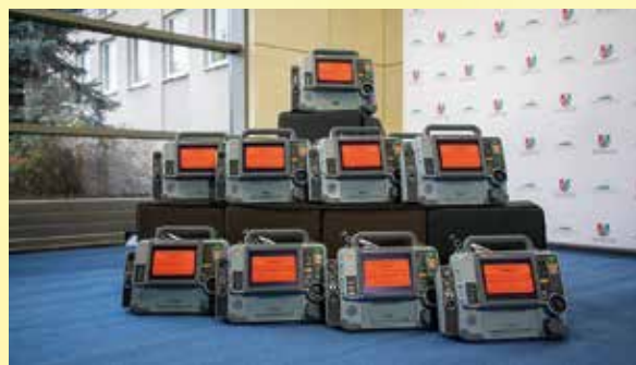
Defibrylatory dla walczących mieszkańców Ukrainy

Dziennikarze spędzili także kilka dni na Ukrainie, gdzie odwiedzili między innymi Chersoń, z którego dramatyczne obrazy bestialstwa na ludności cywilnej obiegły cały świat. Z bliska oglądali, jak wygląda sytuacja Ukraińców zmagających się z rosyjską agresją oraz sprawdzali, jaka pomoc jest tam najpilniej potrzebna.