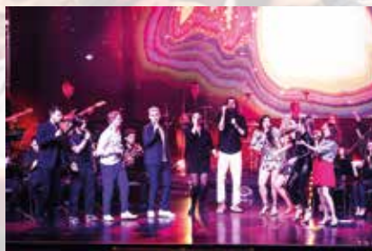
W finale wybrzmiał słynny przebój „Bo jak nie my to kto!!!”