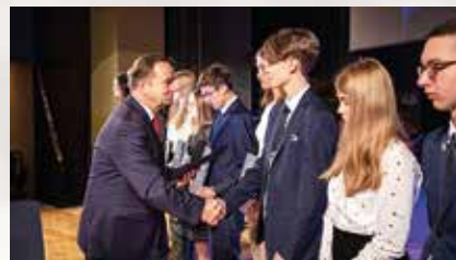
Marszałek osobiście gratulował stypendystom