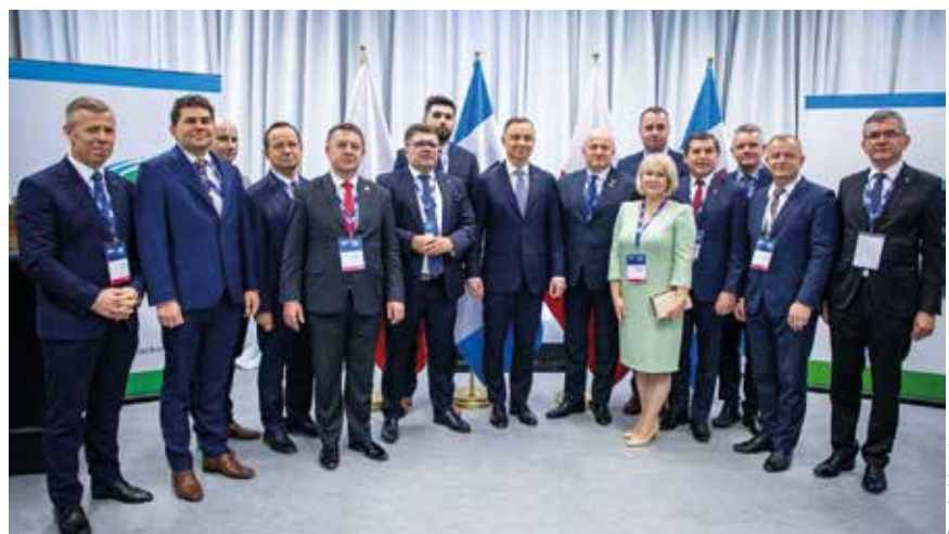
Spotkanie Prezydenta RP z samorządowcami

Przez dwa dni w stolicy Podkarpacia uczestnicy kongresu mieli możliwość zmierzyć się z takimi obszarami tematycznymi, jak: polityka i bezpieczeństwo; gospodarka; rolnictwo i żywność; technologia; transport; energetyka; ekologia; wyzwania społeczne; nauka; kultura oraz zdrowie.