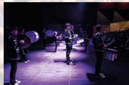
Grupa przecławskich bębniarzy