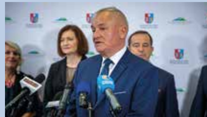
Dyrektor PSST mówi o działaniach jego placówki

środki czystości, odzież, koce itp., które trafiają do magazynów w Rzeszowie i Leżajsku, pochodzą z darów przekazywanych od samorządów, polskich firm, sieci handlowych a także od prywatnych osób i międzynarodowych organizacji humanitarnych.