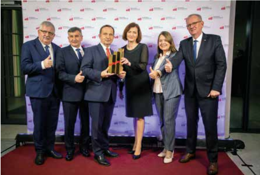
Podczas Gali wręczenia nagród Prezydenta RP statuetkę otrzymało Województwo Podkarpackie

państwa. Tworzymy nowoczesną Polskę, która ma być liderem w Europie, a ma ona być oparta na rodzinie - powiedziała minister.