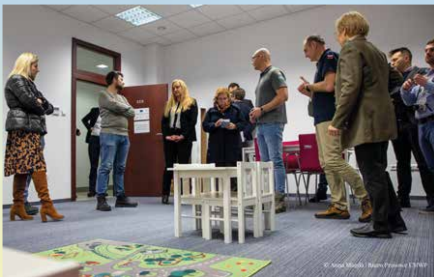
Wizyta dziennikarzy watykańskich w Rzeszowie

Samorząd województwa szuka też pieniędzy w ramach różnego rodzaju konkursów i naborów. Jednym z przykładów jest grant z Ministerstwa Spraw Zagranicznych w wysokości ponad pół miliona złotych, pozyskany w ramach konkursu „Pomoc humanitarna 2022”. Z tego projektu samorząd województwa kupił żywność - ryż, kaszę, groch, puszki mięsne i rybne, kawę, olej, w sumie ok. 38 ton pomocy. Wsparcie trafiło na początku grudnia do Administracji Obwodowych we Lwowie i Użgorodzie.