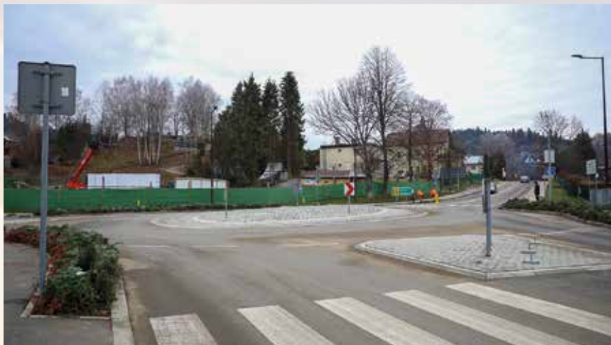
Nowe rondo w Cisnej

Zadanie zrealizowano za prawie 79 mln złotych. Dofinansowanie w ramach RPO WP wyniosło ponad 42 mln złotych. Oprócz tego decyzją zarządu województwa przyznano dotację na realizację tego zadania w wysokości 1 mln złotych, a bezzwrotna pomoc z budżetu państwa wyniosła 11,7 mln złotych. Inwestycję realizował samorząd miasta.