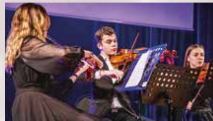
Występ kwartetu smyczkowego