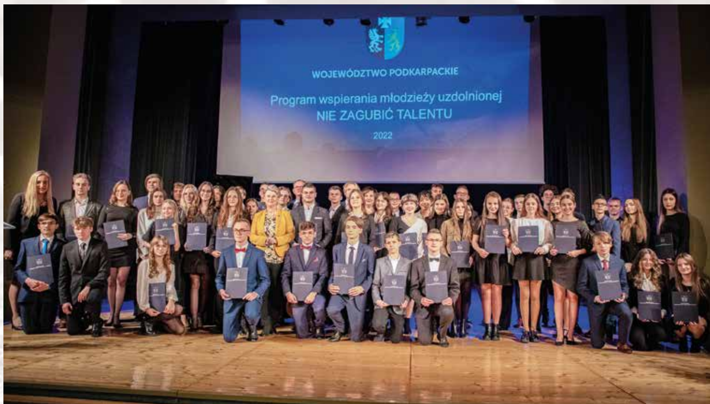
Wspólne zdjęcie zwieńczyło galę

Pod koniec grudnia marszałek wręczył także nagrody przyznane w ramach programu „Nie zagubić talentu”. Trafiły one do 138 młodych mieszkańców regionu w uznaniu ich osiągnięć naukowych, Nagrodzonych zostało także 8 zespołów, w tym sześć artystycznych i dwa naukowe.