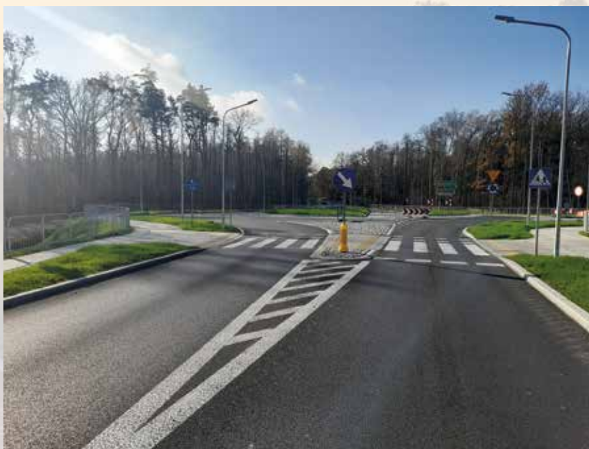
Drogowe inwestycje w Mielcu