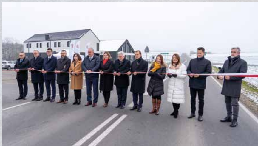
Otwarcie DW 881 po remoncie