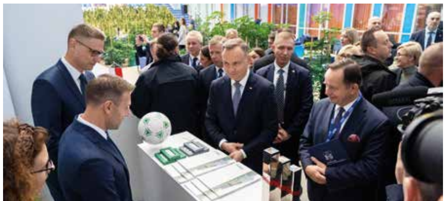
Prezydent RP Andrzej Duda odwiedził stoisko Podkarpackie