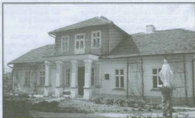
Dom Kantora w Wielopolu Skrzyńskim

Chciałbym w najbliższym czasie pokazać czytelnikom kilka przykładów zdarzeń, które powinny obrazować publiczności międzynarodowej nasz region zachęcając do odwiedzenia go zarówno przez turystów jak i działających i inwestujących w dziedzinie usług przedsiębiorców. Uważam, że szczególnie okres obchodów milenijnych stwarza szansę dla małych lokal-