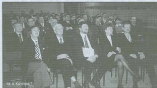
Uczestnicy uroczystej inauguracji studium.