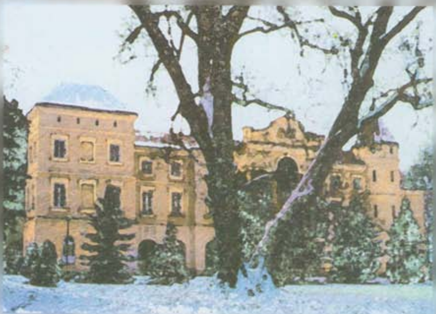
Pałacyk Letni Lubomirskich w Rzeszowie