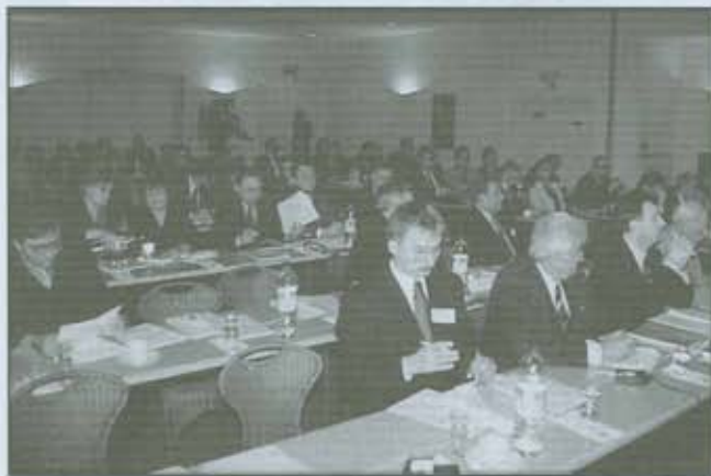
Seminarium w Namur

Stoisko z materiałami reklamowymi województwa podkarpa-