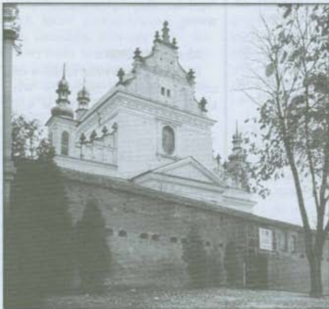
Klasztor oo. Bernardynów w Leżajsku.