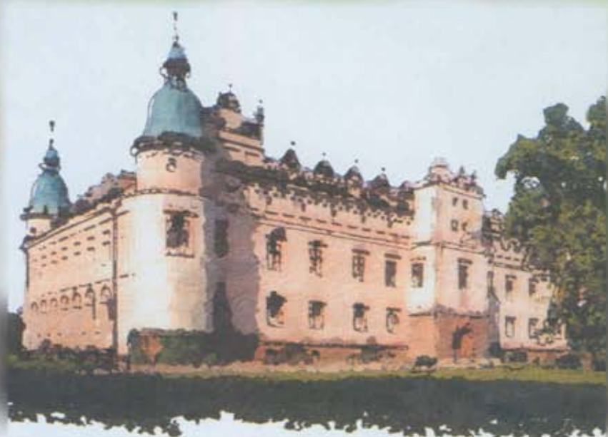
Pałac we Wzdowie