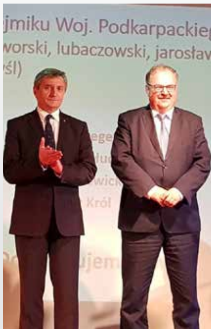
Współpraca z Marszałkiem Sejmu RP Markiem Kuchcińskim