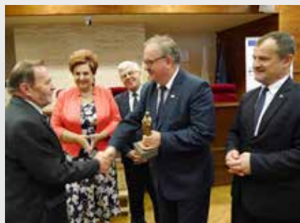
Podkarpackie Święto Miodu 2018 było okazją do uhonorowania zasłużonych pszczelarzy