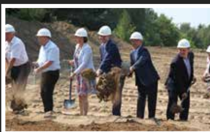
Symboliczne wbicie łopaty pod obwodnicę Kolbuszowej – to jedna z kilkadziesiątu inwestycji drogowych, które trwają na Podkarpaciu