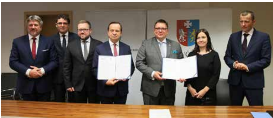
Budowa bazy będzie kosztować około 100 mln zł, fot. D.Kozik

W bazie serwisowej zatrudnienie znajdzie kilkaset osób.