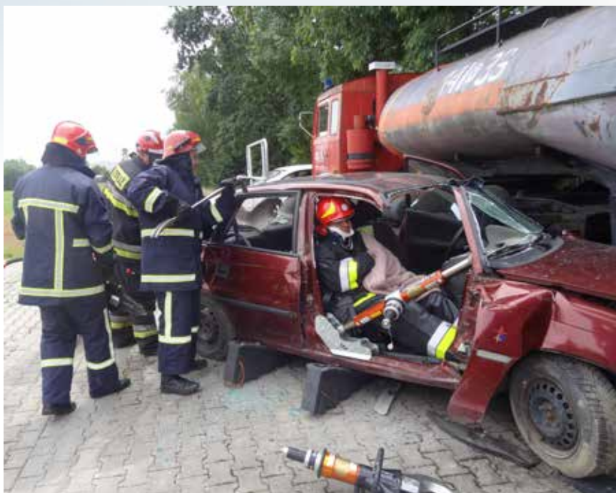
Pozoracja wypadku podczas szkolenia z zakresu ratownictwa technicznego