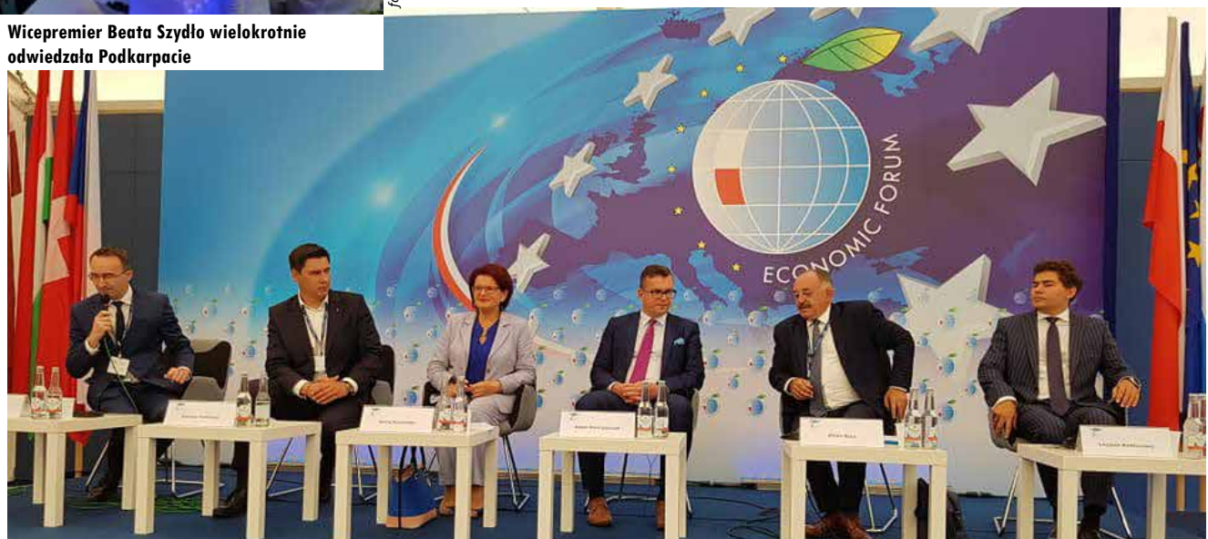
Forum Ekonomiczne 2018 w Kryńcu

Natomiast Samorząd Województwa Podkarpackiego powinien dalej usprawniać infrastrukturę komunikacyjną, wspierać lokalne samorządy gminne i powiatowe, wzmocnić rozwój zakładów i przedsiębiorczości, aby były dobrze płatne miejsca pracy. Wtedy do opuszczonych domostw wrócą ludzie i będzie kwitło życie. Wierzę, że jest to możliwe i tak się stanie.