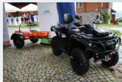
Pojazd czterokołowy z przyczepką do transportu rannych - zakup na rzecz beneficjenta