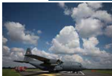
Transportowy olbrzym, czyli Hercules