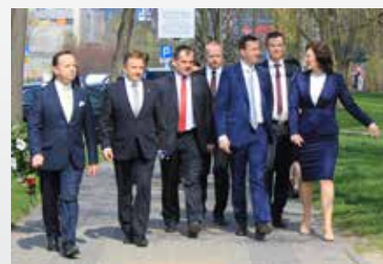
Współpraca rząd i samorząd, fot. M. Mielniczuk