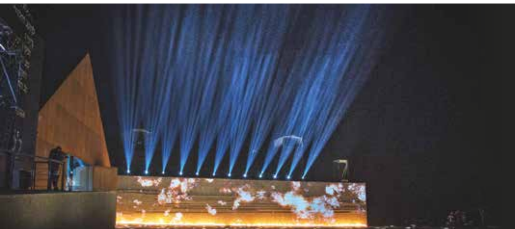
Otwarcie Muzeum Polaków Ratujących Żydów im. Rodziny Ulmów w Markowej