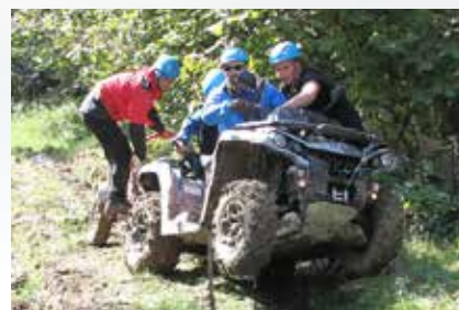
Ćwiczenie technik transportu rannych w trudnych warunkach terenowych, fot. archiwum PSSNU w Obwodzie Iwano-Frankiowskim