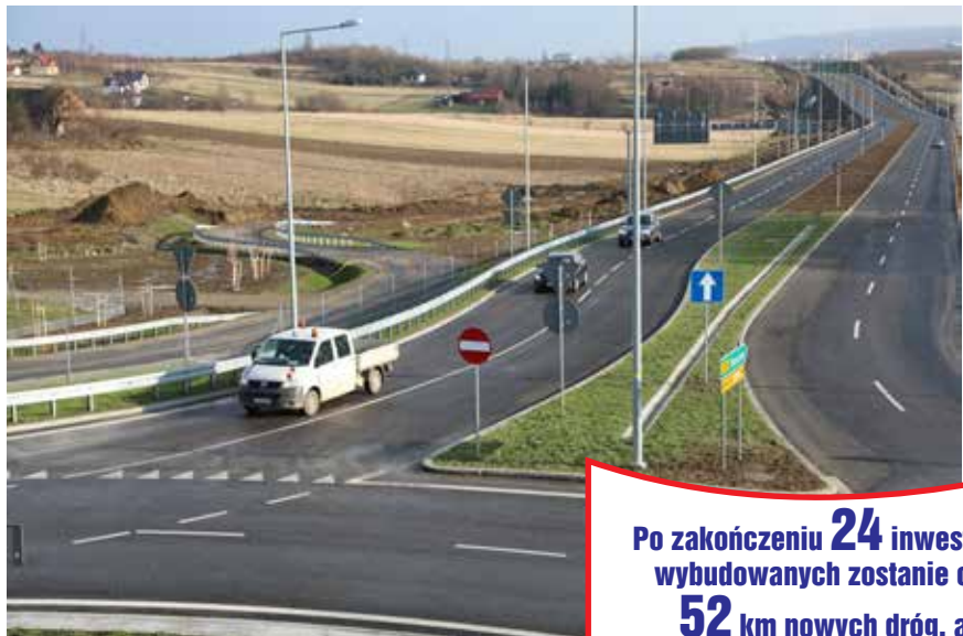
Łącznik z ul. Podkarpacką w Rzeszowie wybudowany dzięki wsparciu z PO PW, fot. M. Konopka

Po zakończeniu 24 inwestycji wybudowanych zostanie ok. 52 km nowych dróg, a 74 km będą wyremontowane