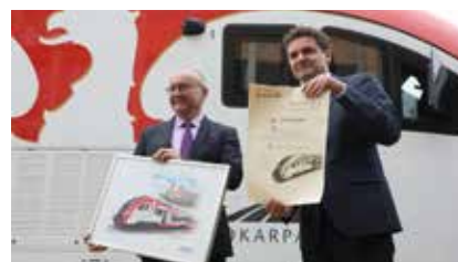
Dzięki dofinansowaniu z RPO WP projektu o wartości 158 mln zł województwo kupiło aż 9 nowych pojazdów od polskich firm PESA i NEWAG, fot. M. Konopka