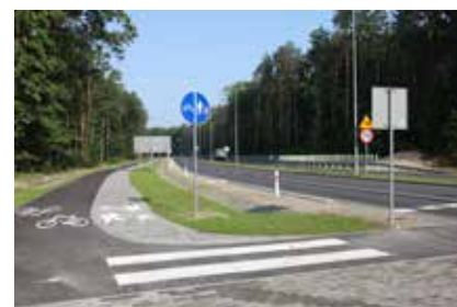
Droga lotniskowa