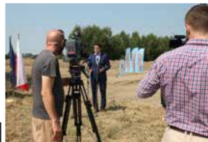
Rozpoczęcie budowy obwodnicy Kolbuszowej