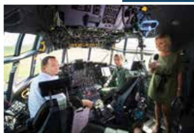
Pokazy w Mielcu relacjonowała TVP

Pokazy współfinansowane były z Funduszy Europejskich. Organizatorami wydarzenia byli: Województwo Podkarpackie, Polskie Zakłady Lotnicze, Miasto Mielec. Patronat nad wydarzeniem objął Minister Obrony Narodowej RP.