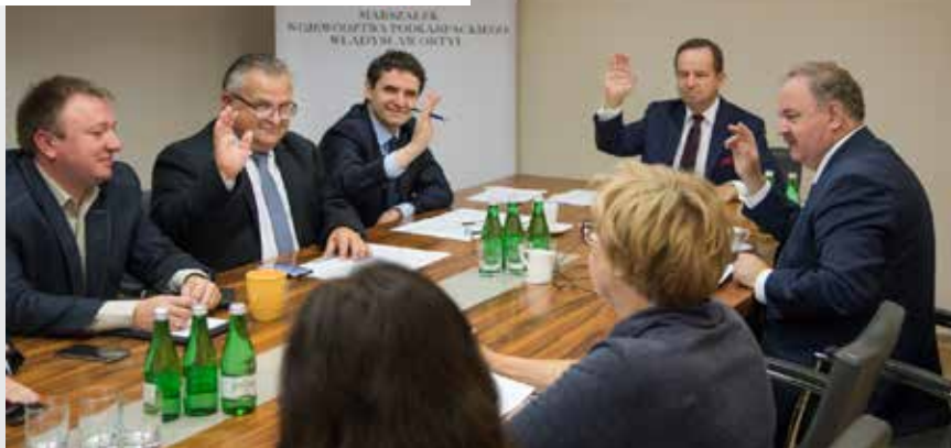
Zarząd Województwa Podkarpackiego we wrześniu podjął 10 000 uchwałę