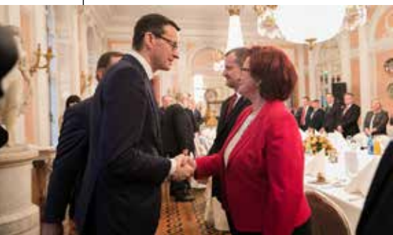
Wizyta Premiera RP Mateusza Morawieckiego w Łańcucie