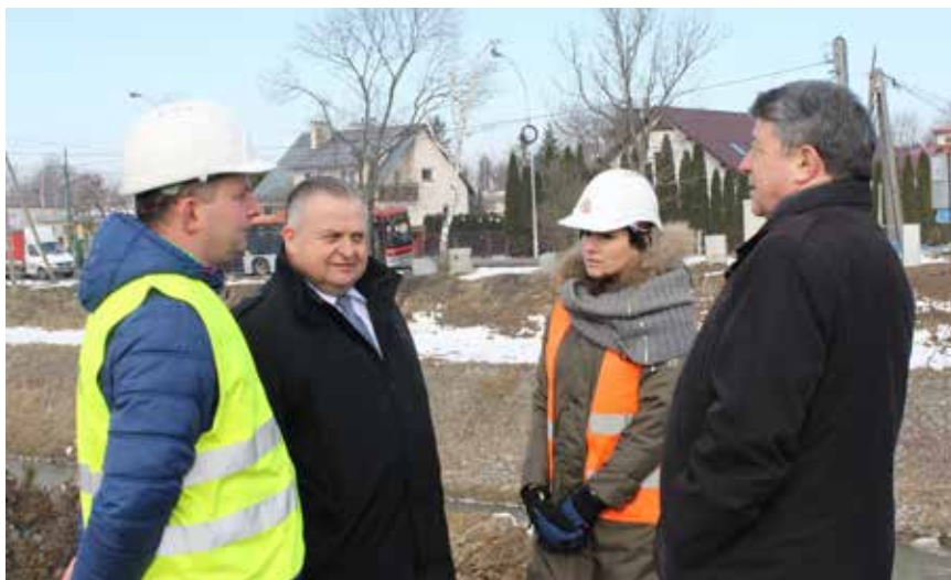
Dzięki środkom unijnym na Strugu w Tyczynie powstał nowy most

Największy sukces to z pewnością uruchomienie Regionalnego Programu Operacyjnego na lata 2014-2020 na kwotę sięgającą 9 miliardów złotych. Środki zostały zainwestowane w rozwój przedsiębiorczości w naszym województwie, w poprawę infrastruktury drogowej i kolejowej. Duże środki włożyliśmy w ochronę zdrowia i w sprawy społeczne. Udało nam się jako samorządowi pozyskać kilkaset milionów złotych dla regionu także z innych programów, np. z Programu Operacyjnego Polska Wschodnia czy Programu Operacyjnego Wiedza, Edukacja, Rozwój.