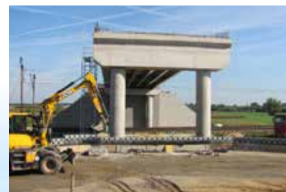
Wiadukt nad linią kolejową - budowa łącznika autostradowego w okolicach Przeworska

Ponad 868 mln złotych na drogi wojewódzkie To kwota z RPO 2014-2020 + 15% wkład województwa