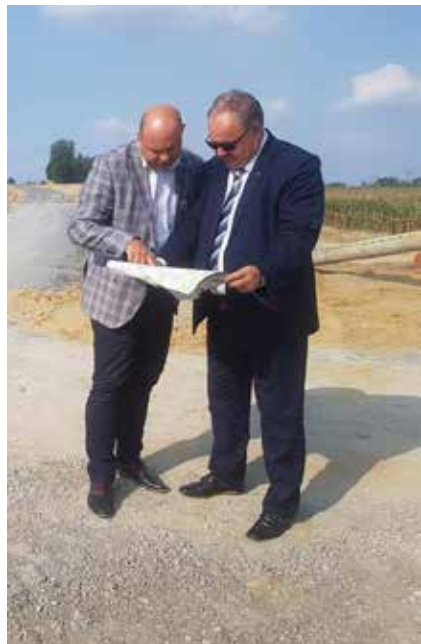
Podkarpacie to wielki plac budowy

Tych sukcesów było sporo. Z pewnością najbardziej cieszą mnie duże inwestycje realizowane na terenie Podkarpacia, szczególnie budowa drogi Via Carpatia oraz rozpoczęcie budowy wielu obwodnic miast, szczególnie na północy regionu, ale także przebudowy dróg i mostów szczególnie w Bieszczadach. W tej chwili można powiedzieć, że Podkarpacie to wielki plac budowy, prawie 40 dużych inwestycji drogowych, to również realizacja lub przygotowanie dużych inwestycji kolejowych – jak tworzenie Podkarpackiej Kolei Aglomeracyjnej, to renowacja linii i dworców, nowy tabor kolejowy i nowa linia kolejowa – połączenie z lotniskiem Rzeszów – Jasionka, która ma zapewnione finansowanie z udziałem środków unijnych z PO Infrastruktura i Środowisko.