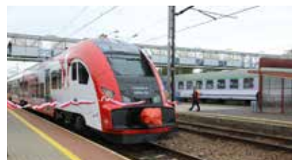
Elektryczny czteroczonowy Elf w barwach narodowych trafia właśnie na podkarpackie tory