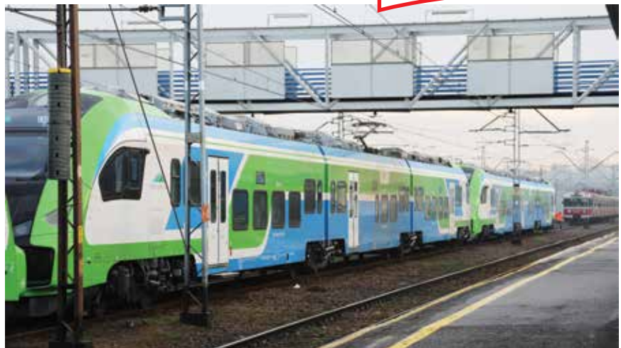
Podkarpackie pociągi w zielono-niebieskich kolorach

Po zakończeniu 24 inwestycji wybudowanych zostanie ok. 52 km nowych dróg, a 74 km będą wyremontowane