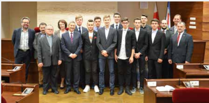
Złota drużyna siatkarki Salosu Don Bosco w Rzeszowie podczas spotkania w urzędzie marszałkowskim