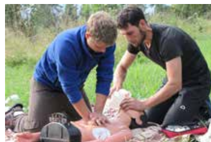
Szkolenie z pierwszej pomocy medycznej