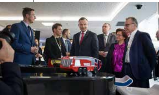
Prezydent RP Andrzej Duda patronuje Kongresowi 590