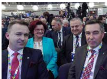
Kongres 590 w listopadzie 2017 roku