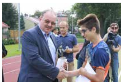
Turniej piłkarski o puchar Proboszcza Parafii Salezjańskiej - wręczenie nagród