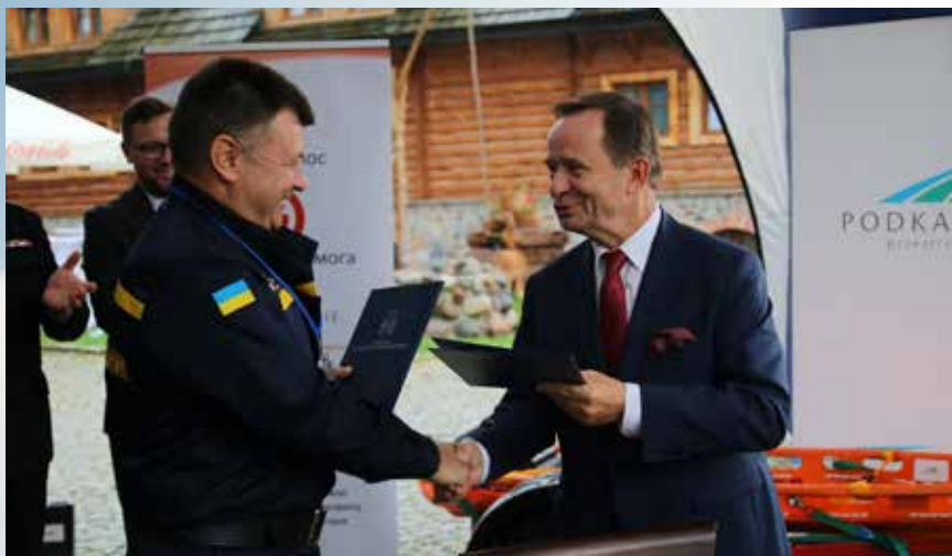
Przedstawiciele beneficjenta i projektodawcy podczas oficjalnego przekazania sprzętu projektowego

Projekt współfinansowany w ramach programu polskiej współpracy rozwojowej Ministerstwa Spraw Zagranicznych RP.