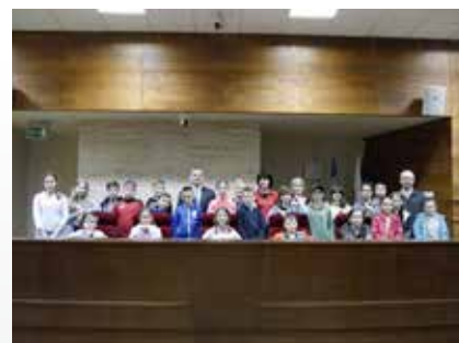
Edukacja obywatelska młodzieży, fot. Izabela Fac