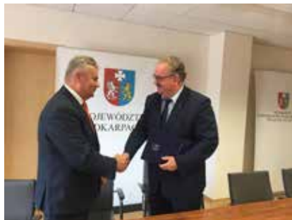
Podpisanie umowy na przebudowę placu handlowego Zielony Rynek w Przemyślu