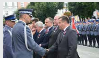
Współpraca z policją