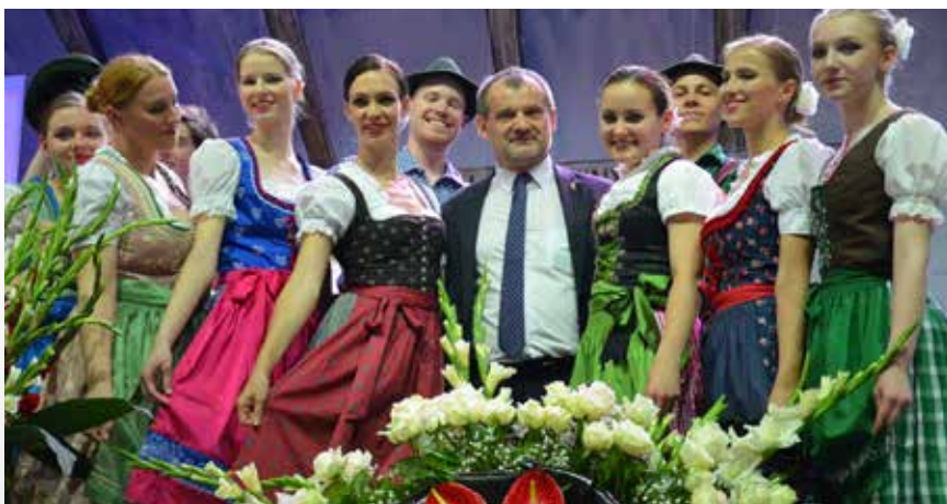
Festiwal polonijny to nauka patriotyzmu i zachowania polskiej tożsamości

Jest jeszcze wiele do zrobienia dla mieszkańców regionu. Istotna jest dalsza poprawa dostępności komunikacyjnej, zwłaszcza na kierunku północno-południowym i to zarówno drogowej, jak i kolejowej. Bardzo ważne jest jeszcze lepsze powiązanie systemu edukacji z potrzebami rynku pracy, by ograniczyć liczbę tzw. „absolwentów kierunków chybionych”.