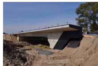
Obwodnica Oleszyc - widok na most na rzece Przerwa fot. PZDW