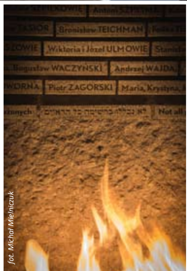
Tabliczka z nazwiskiem Ulmów