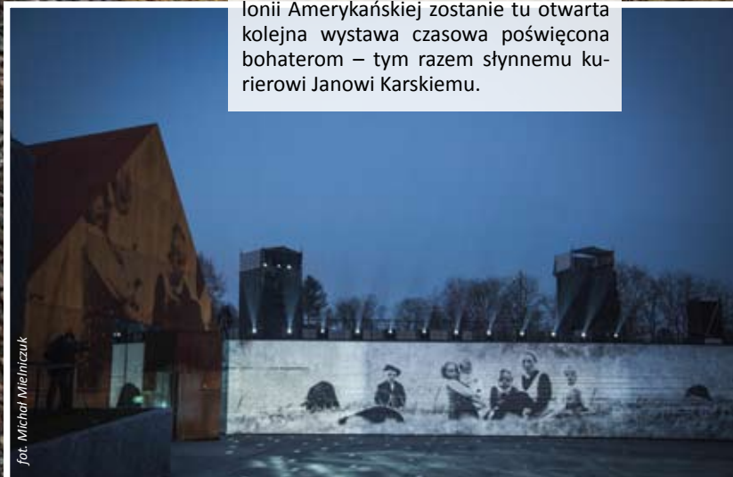
Pokaz multimedialny podczas otwarcia placówki