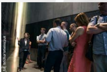
Goście odwiedzający muzeum