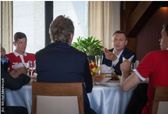
Prezydent RP Andrzej Duda podczas śniadania z kadrowiczami