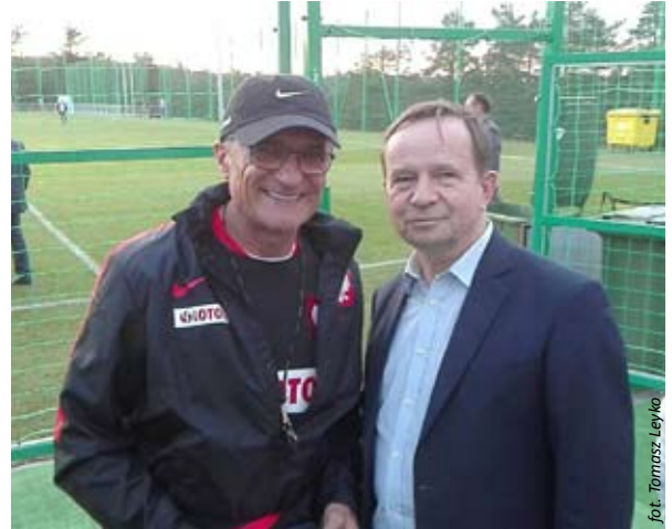
Marszałek Władysław Ortyl przekazał trenerowi Adamowi Nawalce herb woj. podkarpackiego