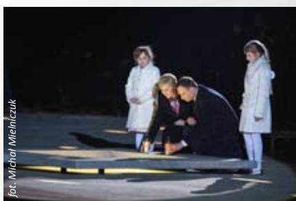
Para prezydencka podczas otwarcia Muzeum